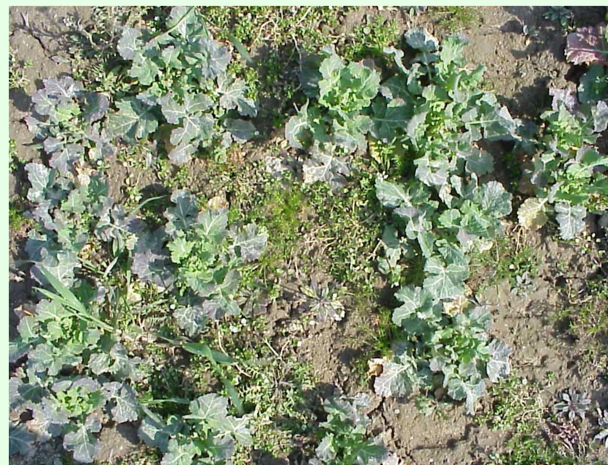
Abb. 1: Winterrapsbestand der Variante Enge Reihe, 06.04.2004

Im Anbaujahr 2004/05 konnte sich der Winterrapsbestand nach der Vorfrucht Klee gras und der organischen Düngung gut entwickeln (Abb. 3, Abb. 4). Die Bestandesdichten lagen in beiden Jahren auf etwa gleichem Niveau und das Unkrautauftreten war im Herbst 2004 sogar deutlich höher als 2003. Die kräftigen Rapspflanzen waren aber eine starke Konkurrenz (Abb. 3) und die optimalen Anbau- und Witterungsbedingungen führten zu sehr hohen Winterrapsenerträgen (Abb. 5). Ein Befall mit Sclerotinia sclerotiorum (Weißstängeligkeit) trat auf. Der Sommerapsbestand musste nach starken Nachtfrösten vom 20. - 22.4. umgebrochen werden.