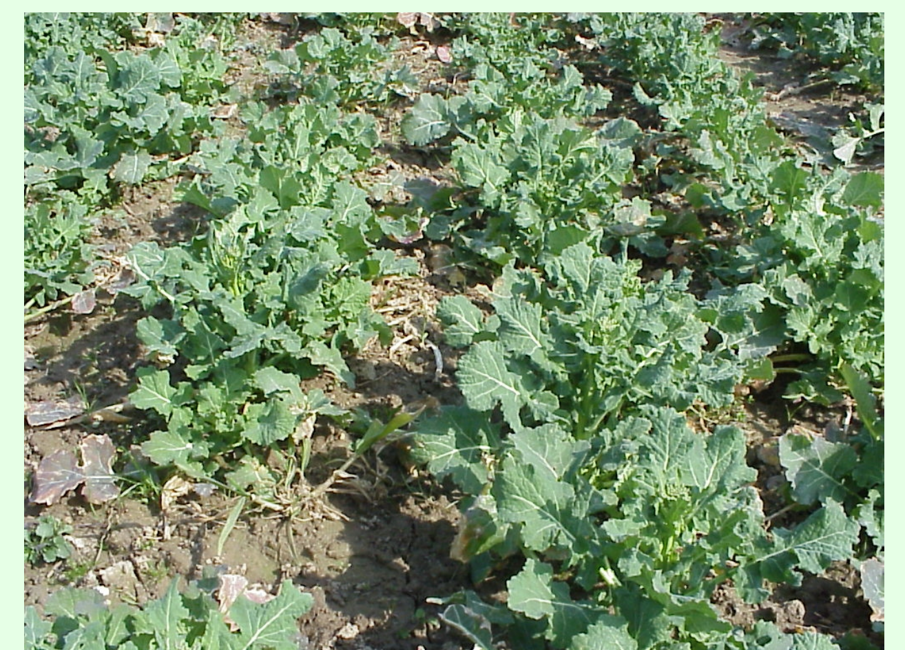
Abb. 4: Winterrapsbestand der Variante Weite Reihe, 12.04.2005