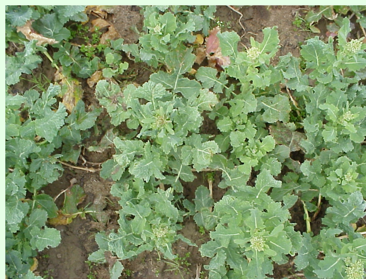
Abb. 3: Winterrapsbestand der Variante Enge Reihe, 12.04.2005