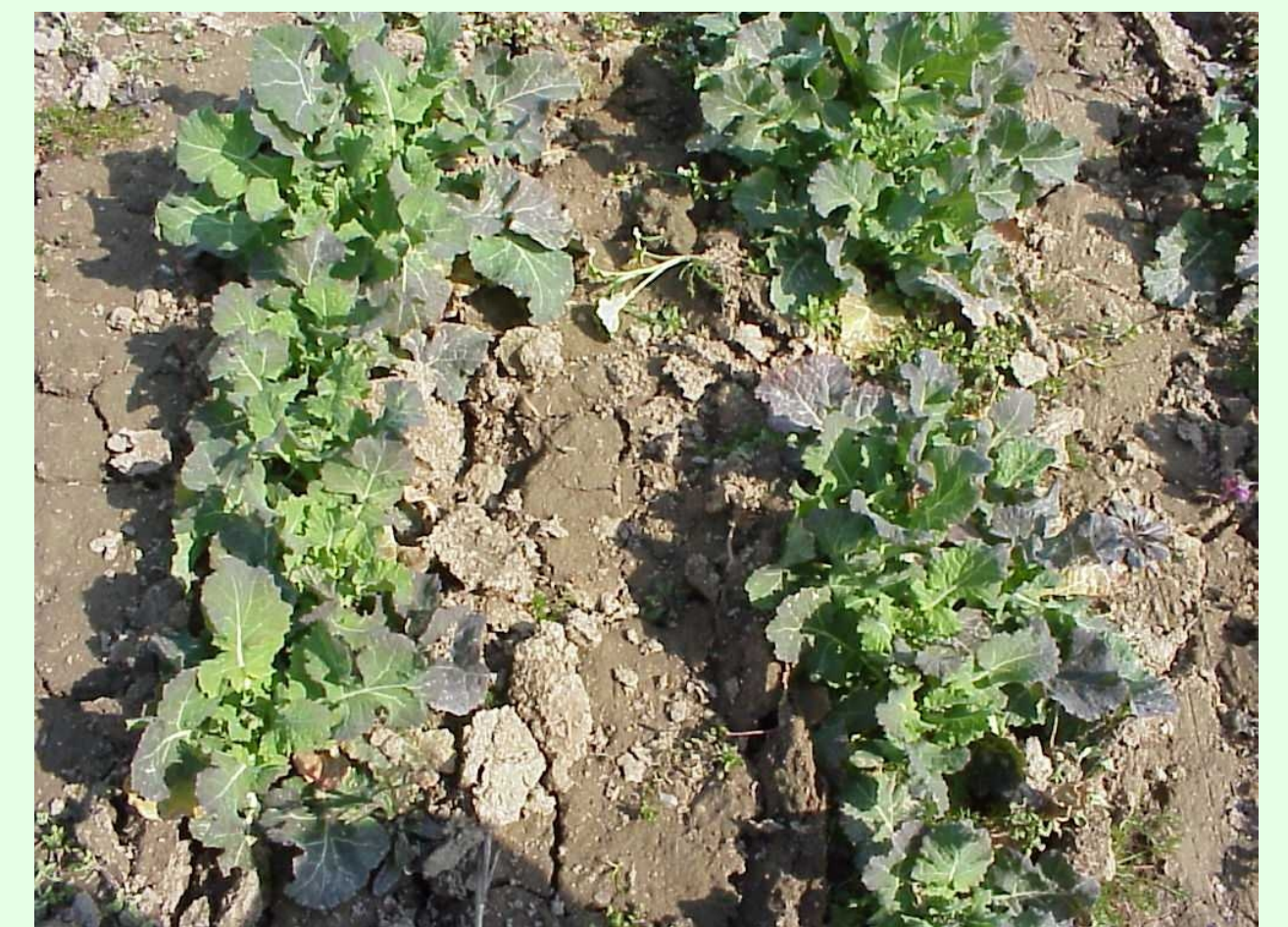
Abb. 2: Winterrapsbestand der Variante Weite Reihe, 06.04.2004