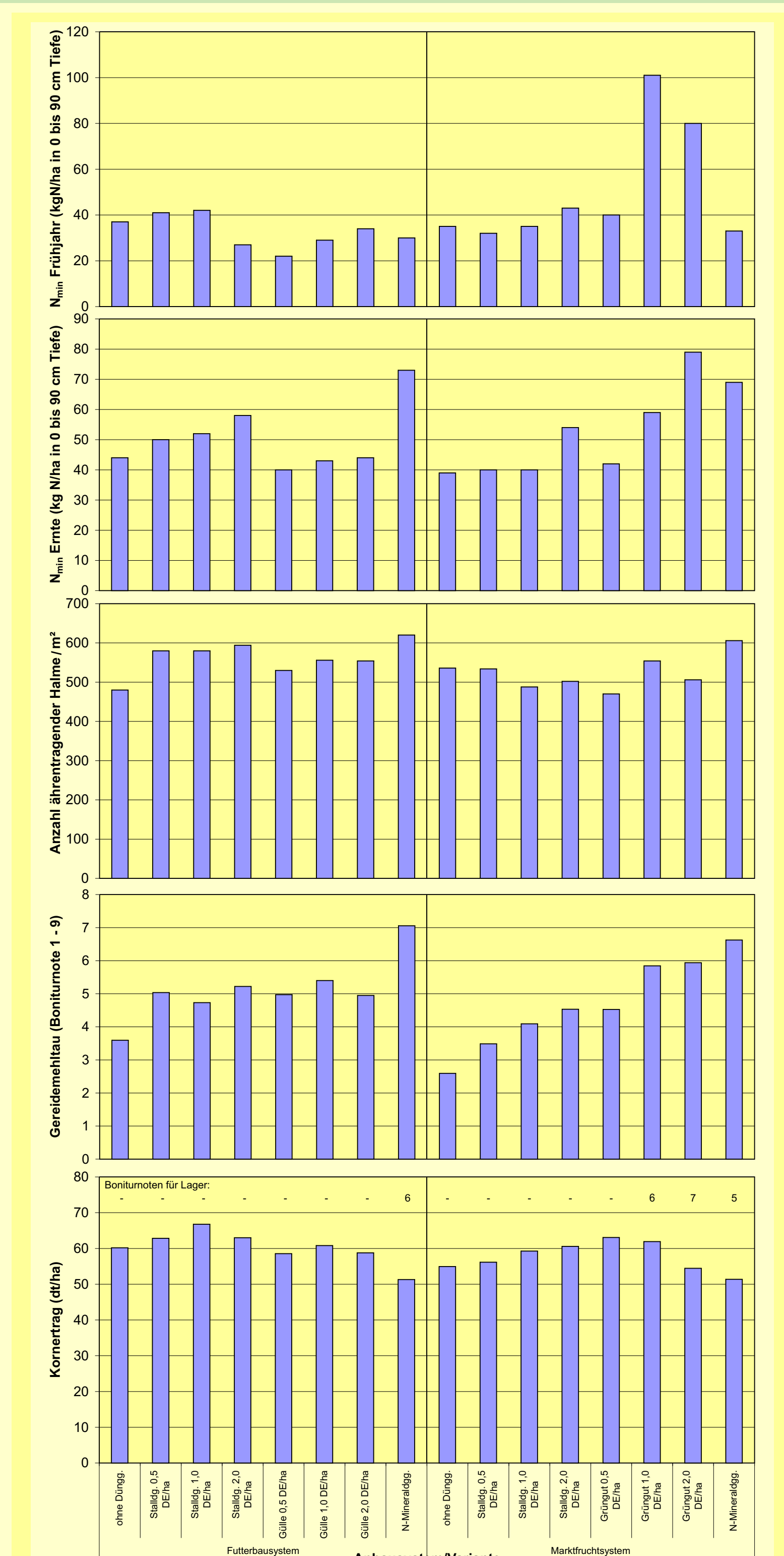
Abbildung 1: Einfluss komplexer Anbau- und Düngemaßnahmen auf die N_{min} -Dynamik im Boden, Anzahl ährentragender Halme, Mehltaubefall, Lager und Kornertrag bei Triticale