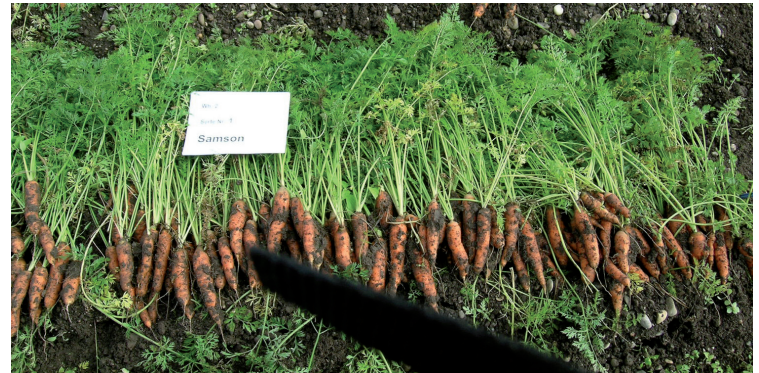
Abb.1: Populationssorte Samson bei der Ernte 2003