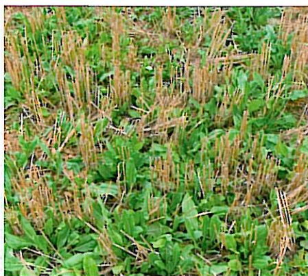
Den måske mest spændende nye art er den korsblomstrede farvevaid

planter, som egner sig til undersåning, og de er jo netop tilpassede til at kunne overvintre.