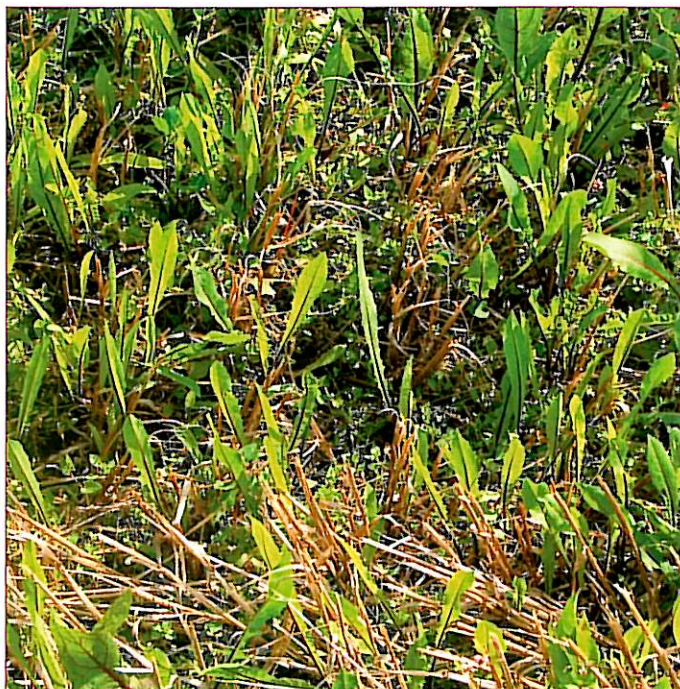
Dyrkning af cikorie som efterafgrøde har i økologisk dyrkning givet cikorie som ukrudt

Men olieræddiken egner sig absolut ikke til undersåning, og hvis man vil udnytte dens fordele, må man finde sig i