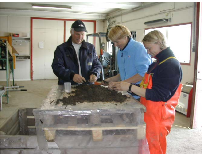
Telling av meitemark er tidkrevende arbeid, så da er det kjekt å være flere sammen.

I konvensjonelle åpenåkerkulturer (vekstskifte av korn) med årlig jordarbeiding og uten tilførsel av husdyrgjødsel, fant vi 30-65 mark/m 2 . I tilsvarende system, drevet økologisk med kløvereng hvert 4. år i kornvekstskiftet, gav 225 mark/m 2 . I vekstskifter med korn og 2-3 årig eng både økologiske og