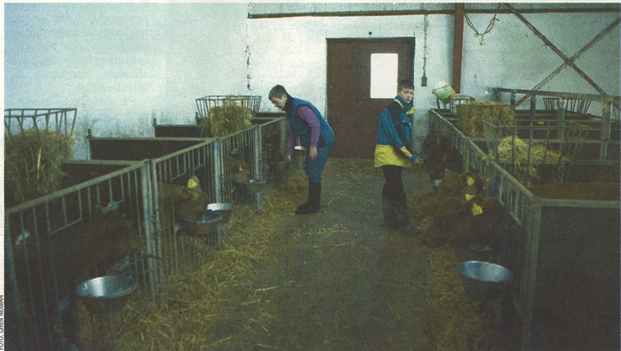
Færdigblandinger til kalve er forholdsvis dyre, men et nyt forsøg fra Dansk Landbrugsrådgivning viser, at man med godt resultat kan blande sit eget foder til kalvene og opnå ligeså god tilvækst, som når man anvender indkøbte færdigblandinger.

Prisen på den indkøbte færdigblanding i forsøget var 2 kr. pr. FE, mens prisen for hjemmeblandingen med ærter er opgjort til 1,94 kr. pr. FE. Blandingen med lupin var den billigste og kostede 1,84 kr. pr. FE. I prisen for hjemmeblandingerne indgår 30 øre pr. FE til arbejds løn.