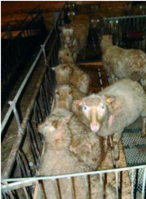
Sauer som ligger på liggepall.

To ulike utforminger av liggeareal i eksisterende bygninger har blitt utprøvd på tre Vestlandsgårder. Liggearealet var utformet med henholdsvis liggepall foran og bak i bingen, og u-forma liggepall i bakkant av bingen.