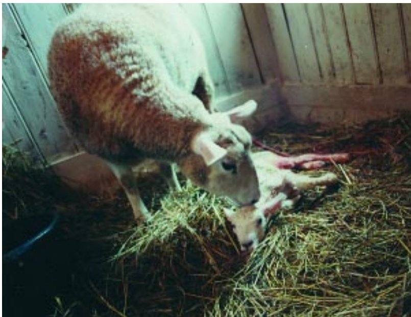
Det viktigste tiltaket for å forbygge sykdom hos lam er å sikre at de får en skikkelig dose råmelk ved fødsel (innen to-fire timer!)

For å kartlegge gode og svake sider med beiteopplegget sitt bør en følge med vekta på lamma. En bør veie en gruppe av flokken ved lamming (fødselsvekt), ved beiteslipp