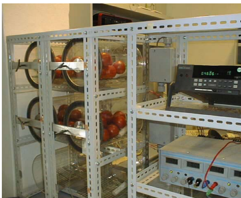
Abb. 2: Messung der Atmungsintensitäten

Die Kontrolle der Klimabedingungen in den einzelnen Phasen der Nacherntesimulation erfolgte mit verschiedenen Dataloggern über die Lufttemperaturen, relative Luftfeuchten und Luftdrücke erfasst und in wählbaren Intervallen gespeichert werden konnten.