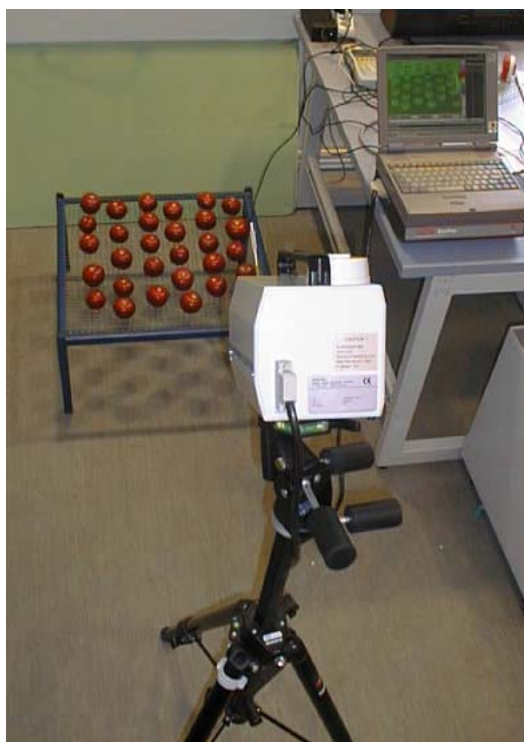
Abb. 3: Messung von Transpirationswiderständen

Zur Charakterisierung des Transpirationsverhaltens der Produkte wurde ein am ATB entwickeltes Messprinzip eingesetzt, mit welchem der Wasserzustand von Produkten und eine Kenngröße zur Charakterisierung der Luftströmung in unmittelbarer Nähe des Produkts getrennt bestimmt werden kann (GEYER UND LINKE 2001). Dazu werden Transpirationswiderstände genutzt, die den Wasserzustand eines Produktes charakterisieren und mit einfachen Mitteln gemessen werden können. Der Gewebewiderstand ist artspezifisch, außerdem abhängig vom Entwicklungszustand eines Produkts, den Vorerntebedingungen und den Belastungen in der Nachernte (MÜLLER UND LINKE 2002). Der Grenzschichtwiderstand ist ein Maß für die vorhandenen An- und Umströmungsbedingungen. Dessen resultierende Größe ergibt sich durch Überlagerung einzelner Grenzschichten im Bündel, in Schichten und/oder durch den Schutz von Verpackungen. Dabei wirken die erhöhten Grenzschichtwiderstände wie eine Erhöhung der relativen Luftfeuchte am Produkt (Luftfeuchte-Äquivalent). Zur Bestimmung der Transpirationseigenschaften werden zunächst die Transpirationswiderstände (Gewebewiderstand, Grenzschichtwiderstand) von Einzel Früchten gemessen.