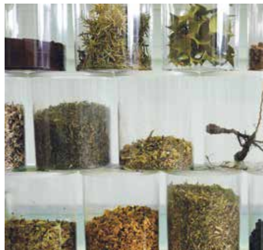
Rimedi dolci per il bestiame.

Per la pulizia di ferite superficiali possono essere utilizzate tinture alcoliche prodotte in modo tradizionale con achillea,