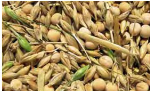
Kombajn nastavíme na hrách. Proto na zrnech ječmene zčásti zůstávají osiny, což ale nebývá z hlediska výkupu problematické.