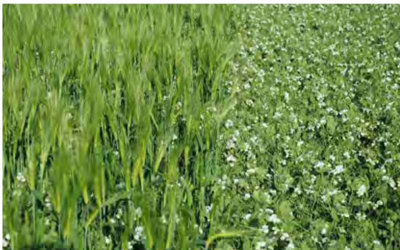
Vlevo: krmný hrách ve směsce s ječmenem; vpravo krmný hrách jako monokultura.

Ochota dvou výkupů odebírat směsky ve zralém stavu, třídít je a skladovat znamenala ve Švýcarsku průlom v produkci krmného hrachu. Od té doby se produkční plocha směsek zvýšila z 50 na více než 500 ha.