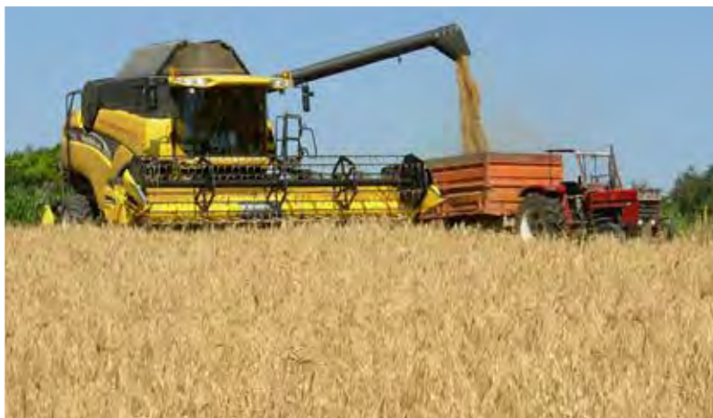
Sklizeň lze při pečlivém nastavení provést každým běžným kombajnem.