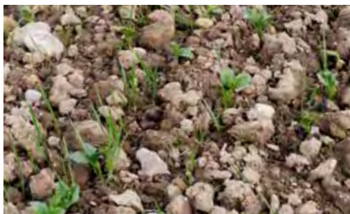
Poněkud hrubší seťové lůžko snižuje nebezpečí rozplavení půdy.