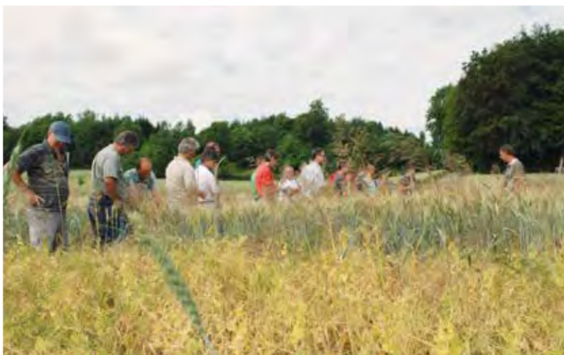
Provozní pokusy poskytují cenné informace k dosud otevřeným otázkám.