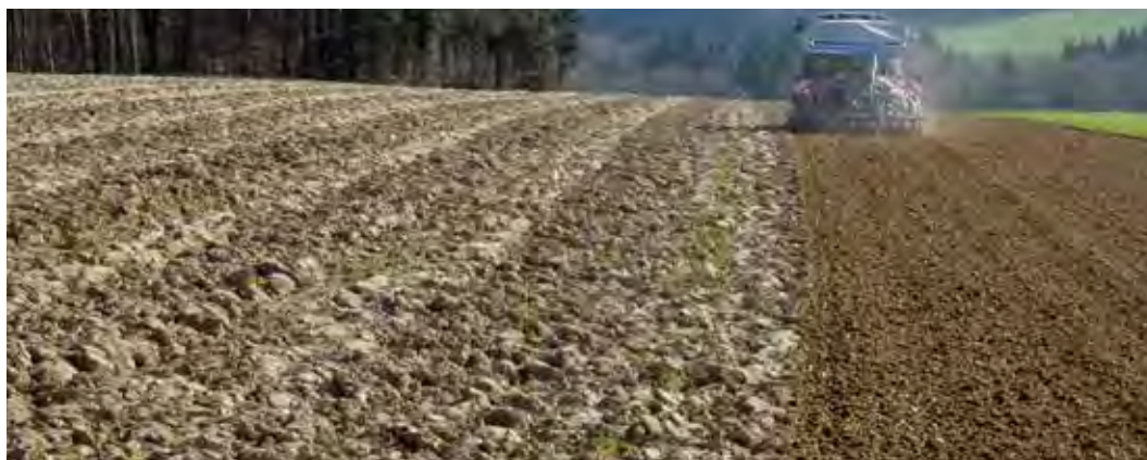
Hráč dává přednost lehkým, hlubokým půdám bez utužení.