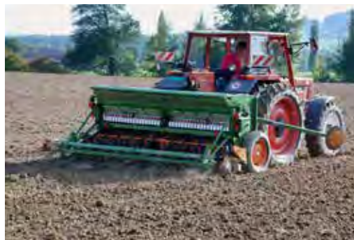
Mulčovací výsev v jedné pracovní operaci, jako zde v porostu svazkeny, je šetrný k půdě.