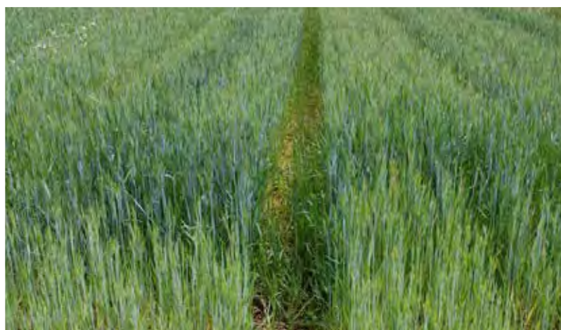
Pohnojení kejdou podpoří růst obiloviny na úkor luskoviny.

Aplikace zralého kompostu ze zelené hmoty nebo z hnoje před výsevem může mít pozitivní efekt na zdravotní stav luskoviny a je zdrojem velkého množství fosforu a draslíku.