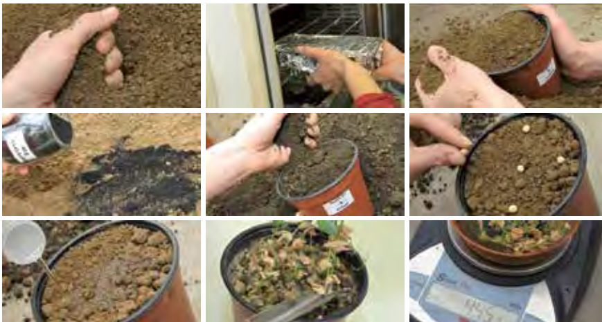
Tato prognostická metoda je poměrně jednoduchá a lze ji provést s minimálními náklady.