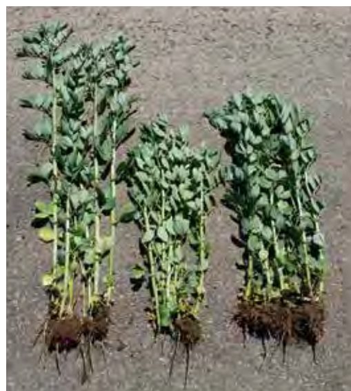
Odrůdy bobu se v některých případech značně liší vzrůstností a nepoléhavostí.

U ozimého ovsa je výběr odrůd prozatím velmi malý, u jarního ovsa je větší. K jarnímu bobu bychom měli vzhledem k pozdějšímu dozrání zvolit pozdní odrůdu ovsa odolnou proti poléhání.