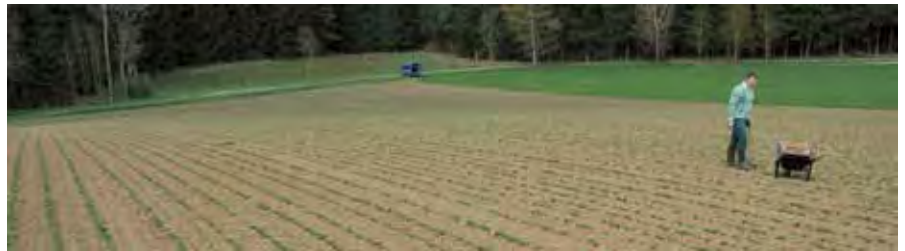
Rozhodující podmínkou pro průkaznost výsledku je reprezentativní půdní vzorek.

Únava půdy může způsobovat nízké výnosy hrachu a fazolu. Pro zemědělce je obtížné předem odhadnout toto riziko. Představená prognostická zkouška může být pomůckou při výběru pozemku.