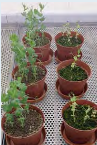
Pomocí malého nádobového pokusu lze před pěstováním hrachu identifikovat půdu s leguminóзовou únavou. Vlevo: sterilizovaná půda, vpravo: neošetřená půda s leguminóзовou únavou.

Při výskytu takzvané leguminóзовé únavy půdy se hrachu (a zčásti i jiným leguminóзам) daří kvůli různým půdou přenášeným chorobám velmi špatně, případně vůbec neroste.