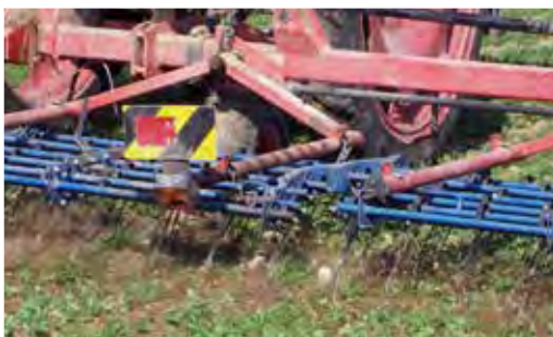
Při vysokém tlaku plevele, na spíše lehké půdě, je vhodné porost jednou převléct plecími brami.

Jarní výsevy bývají vzhledem k pomalému jarnímu vývoji náchylnější na zaplevelení než podzimní výsevy. Proto je u jarních výsevů důležitá mechanická regulace plevele v dubnu/květnu.