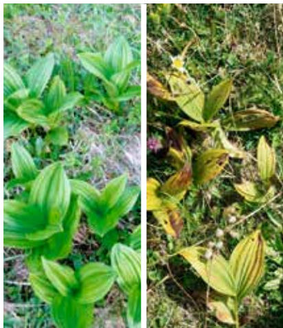
Vératres blancs en mai (à g.) et en juillet (à d.) de cette année.

Aucun vératre blanc n'a fleuri cette année en Suisse. Les jeunes plantes ont poussé aussi vigoureusement que d'habitude au printemps puis elles ont dépéri lentement pendant l'été sans que