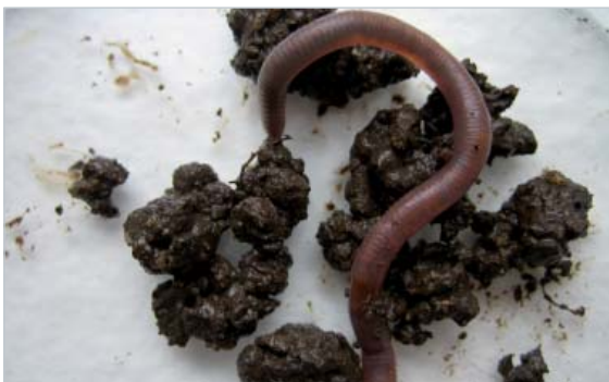
Fig.1. Grå meitemark - en hardhaus, og den vanligste arten meitemark i norsk dyrka jord. All "jorda" på bildet er ekskrementer fra grå meitemark.

Stor meitemark og lang meitemark bruker ekskrementer og slim til å kitte sammen og gjøre gangveggene glatte og stabile. Næringsinnholdet i slike gangvegger kan være over dobbelt så høyt som i jorda utenfor. Stor meitemark eter mer ferskt og konsentrert organisk materiale enn grå meitemark, og ekskrementene inneholder derfor mer plantenæringsstoffer. Som fig. 1 og 2 viser, er også ekskrementer fra jordlevende meitemark (grå og rosa) mer næringsrike enn jorda rundt.