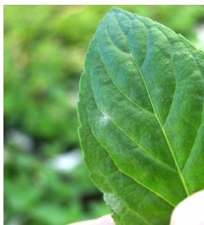
Meldugg på peppermynte

Meldugg: Meldugg kan være et problem i de lange kulturene og de stiklingsformerte som rosmarin, peppermynte og fransk estragon. Meldugg holdes nede med riktig klimastyring, godt renhold og god balanse i plantene. Hvis smittepresset blir for stort kan en sprøyte med såpe.