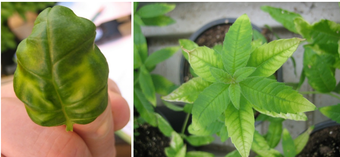
Næringsmangel i basilikum og sitronverbena

Ved næringsmangel er det flere ulike typer organiske mikrogjødsel på Debio sin driftsmiddel liste å velge mellom. Ved dokumentert mikro næringsmangel er det også tillat å bruke mineralisk mikrogjødsel.