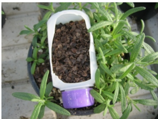
Utsett av nyttedyr

Mange av krydderurtene har kort produksjonstid og når plantene selges følger mange av nyttedyrene med ut av veksthuset. Det er vanskelig å få etablert en fast bestand av nyttedyr i veksthuset og nyttedyrene må derfor settes ut regelmessig. Det anbefales å sette ut limfeller, gjerne på blomsterpinner som stikkes i pottene. Disse bør sjekkes jevnlig får lettere å ha kontroll på når det kommer skadedyr og omfanget av angrepet.