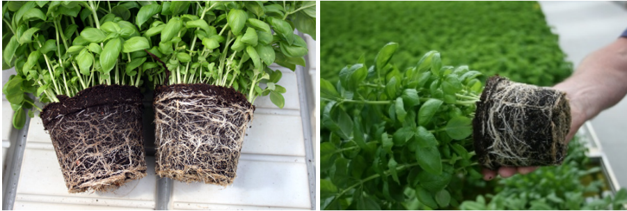
Røttene er alfa omga (konvensjonell t.v. økologisk t.h.) Gode røtter gjenspeiler god vekst

skadelig for frø og stiklinger. Ammoniakk gassen lukter en veldig lett, så det bør være enkelt å unngå. Jord bør generelt luftes godt før den brukes enten om den kommer i små eller store sekker. Det anbefales å ta en mottakskontroll av torven før den taes i bruk. Sjekk strukturen og ta en lukte test (skal lukte godt, frisk jord).