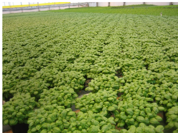
Jevn Basilikum med flott kvalitet