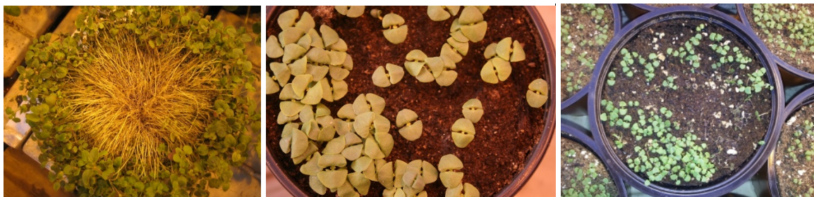
Sådd for tett og angrep av gråskimmel i sitronmelisse, ujevn spiring og angrep av sopp i basilikum

Frøet kan med fordel dekkes med vermiculitt/perlitt og pottene dekkes med plast etterpå. Pass på å fjerne platen straks frøene har spirt ellers strekker spirene seg. De fleste arter spirer raskest ved høy temperatur, men enkelte arter spirer dårlig ved høy temperatur (problem på sommeren). Har en mye lys og høy temperatur i ferdigvareproduksjonen kan en la plante spire i samme avdeling som denne, men ved lite lys bør nok plantene spires i eget rom med høyere temperatur for å få god og jevn spiring.