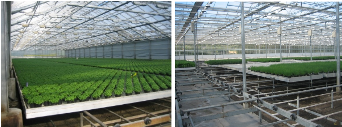
Dyrking av basilikum og gressløk på flo og fjærebord

Kontinuerlig vanning på flo og fjære bord.