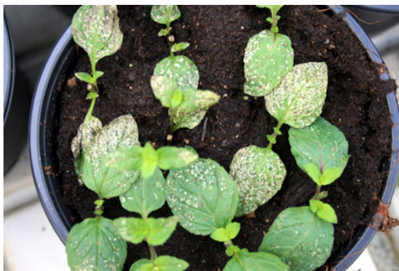
Kraftig med tripsangrep på sitrontimian og peppermynte