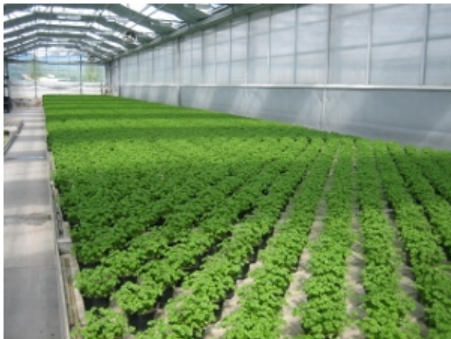
Produksjon av krydder på flo og fjære bord

Helårsproduksjon i veksthus av økologisk krydder i pottes er en ung produksjon i Norge. Per i dag er det 17 mål med økologisk krydderproduksjon i Norge.