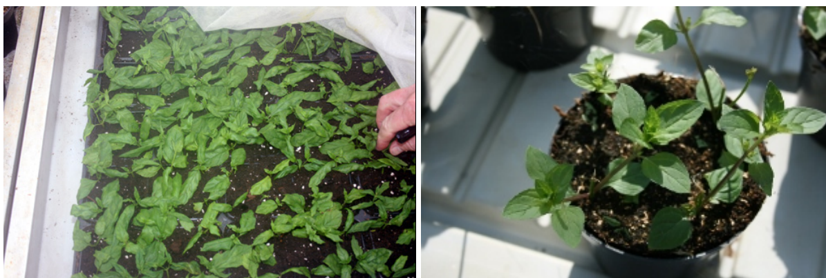
Stiklingsformering av peppermynte

Peppermynte er svært lett å formere, mens fransk estragon er svært vanskelig da den roter seg seint. Det er også mulig og kjøpe ferdige økologiske stiklinger fra småplanteleverandører.