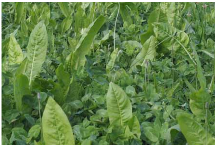
Billede fra parcelforsøg med urtekløvergræs i 2015.