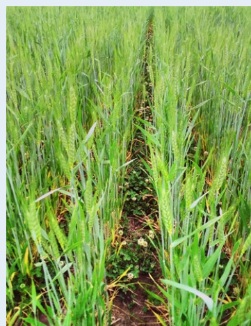
Выращивание зерновых по технологии no-till под белым клевером в качестве живой мульчи

Тем не менее, подходящее удобрение остается ключевой проблемой для получения хороших урожаев. Локальное удобрение гранулами или гранулированным продуктом, возможно, смешанным с семенами, может помочь преодолеть недостаток бодрости на ранних стадиях роста культуры.