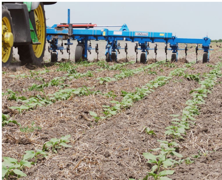
Борьба с сорняками обычно является самой большой проблемой в системах с сокращенной обработкой почвы в органическом земледелии.

Севооборот, сроки обработки почвы, покровные культуры и зеленые удобрения способствуют улучшению конкуренции культур с сорняками. Кроме того, сорняки можно контролировать механически в течение периода выращивания культуры благодаря частичной заделке расти-