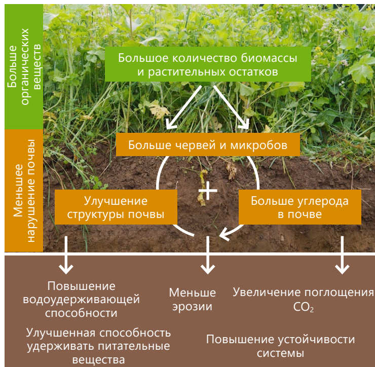
Рисунок 2: Динамика накопления углерода в почве

При сокращенной обработке почвы биомасса заделывается в почву поверхностно и меньше нарушается почва по сравнению с обычной вспашкой, что улучшает качество почвы различными способами, удерживая больше углерода в системе.