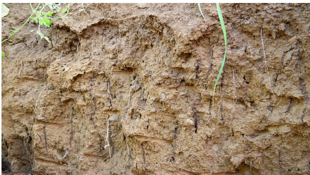
Сокращенная обработка почвы щадит дождевых червей. В результате корни растений могут легче прорасти в почву через ходы дождевых червей.

Сокращенная обработка почвы, в сочетании с постоянным почвенным покровом, также является отличным средством для предотвращения эрозии почвы. Увеличение инфильтрации воды, удержание осадков покровными культурами и растительными остатками, а также высокая прочность почвенных агрегатов благодаря повышенному содержанию органического вещества в почве способствуют снижению эрозии почвы и рисков, связанных с внезапными наводнениями.