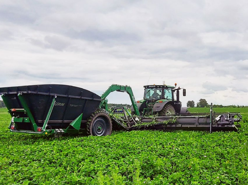
Механическое удаление верхушки сорняков в посевах на корню – эффективная мера предотвращения экспоненциального роста семенных сорняков.

зеленых удобрений могут очень эффективно подавлять сорняки.