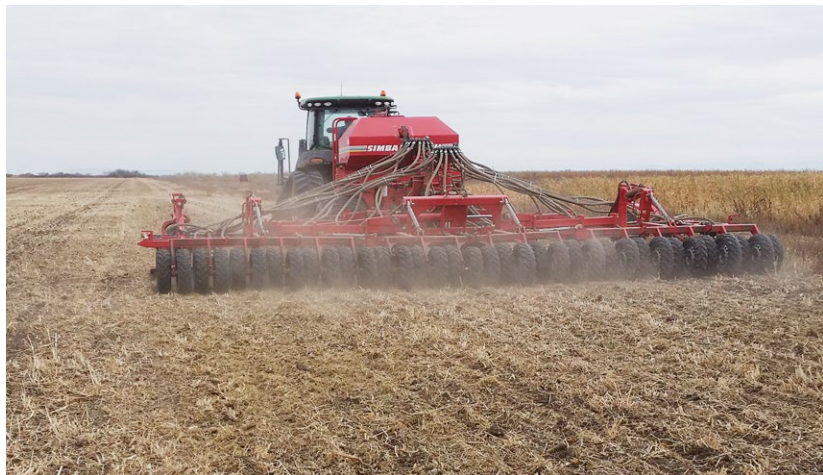
Успешное внедрение сокращённой обработки почвы во многом зависит от собственного опыта и наблюдений.

Сокращённая обработка добавляет сложности в органическое производство. Успешный переход от стандартного использования отвального плуга требует хорошего «понимания» производственной системы. Главным вопросом является то, как можно оптимизировать севооборот с покровными культурами и целенаправленным использованием техники для эффективной борьбы с сорняками и своевременного снабжения культур азотом. В этом контексте собственный опыт очень важен для изучения. Сокращённая обработка почвы требует «прагматического подхода к обучению» и тщательного наблюдения за состоянием почвы, культур и сорняков для оптимального сочетания и корректировки применяемых методов и орудий в конкретных условиях.