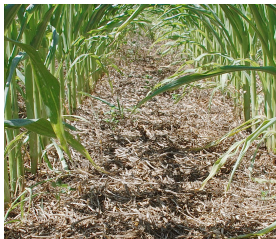
Мульча и покровные культуры обеспечивают укрытие и корм для наземной биоты.

В отличие от обычной вспашки, сокращенная обработка почвы требует меньше топлива и меньших затрат на рабочую силу. Общество в целом выигрывает от сокращения выбросов от использования ископаемого топлива.