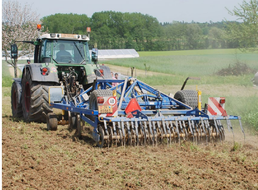
Очень поверхностное лушение дернины прицепным плоским культиватором с сошниками (например, «Treffler») оставляет очень мелкие комки травы, которые быстро высыхают.