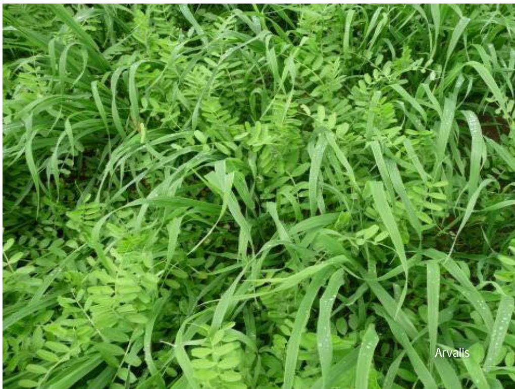
Avoine, vesce : piègeage et fourniture d'azote + bonne couverture du sol

Les mélanges permettent de répondre à plusieurs objectifs en même temps. A chacun d'adapter et de créer le mélange en accord avec ses objectifs.