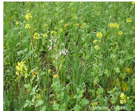
Moutarde, radis, lin, vesce, tournesol

Le développement de la biomasse racinaire, moins important chez les plantes annuelles, est en adéquation avec la biomasse aérienne. Pour les