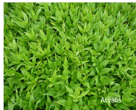
Nyger : adapté au semis de juillet

Les semis sous couvert permettent d'éviter une période pendant laquelle la terre est nue et, donc, la levée d'adventices. Cette technique présente beaucoup d'avantages. Malheureusement peu d'espèces sont adaptées à ce type de semis. En effet, seules les espèces à développement lent et qui ne montent pas dans la culture sont adaptées. De plus, ce type de semis n'est possible que pour des espèces à petites graines qui n'ont pas besoin d'être enfouies