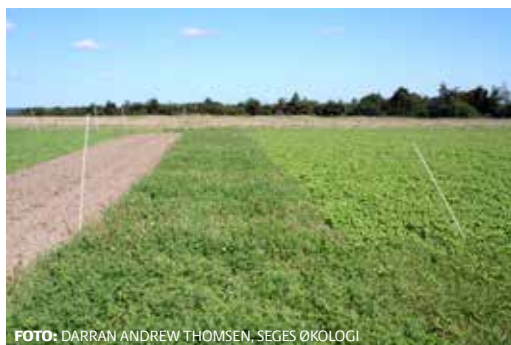
Fra venstre mod højre: Harvet kontrol, undersøet kløver og gul sennep sået efter høst. Billedet er taget før såning af vinterhvede.

Der er gennemført to forsøg med fem forskellige mellemafgroder og et harvet led som kontrol, se Tabelbilaget, tabel P8. Der er harvet forud for etablering af mellemafgroderne efter høst 2014. Vinterhveden er sået direkte, der er således ikke pløjet i forsøget.