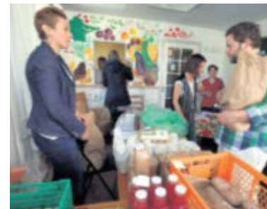
Food Community in der Stadt Aarhus, DK

www.oekolandbau.de/verarbeiter/betriebsmanagement/verkaufspraxis/onlineshops/regionalLebensmittel-online-verkaufen/