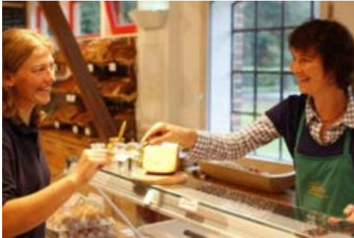
Hofladen auf Hof Klostersee, Schleswig-Holstein

Definition: Direkter Absatz landwirtschaftlicher Produkte an Konsumenten und Wiederverkäufer sowie an Großverbraucher und die Gastronomie