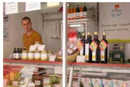
Käse-Lindner in Berlin, Produkte aus Brodowin, Land Brandenburg