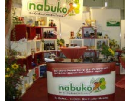
Bio-Caterer und Großverbraucher-service, Uelzen, Niedersachsen

Definition: Direkter Absatz landwirtschaftlicher Produkte an Konsumenten und Wiederverkäufer sowie an Großverbraucher und die Gastronomie