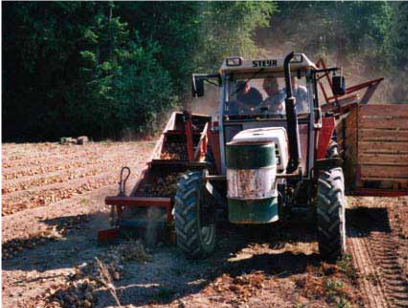
Gepflanzte Zwiebeln mit 6–7 Pflanzen pro Topf und 30 × 30 cm Abstand gedeihen gut und sind – relativ – einfach zu jäten.