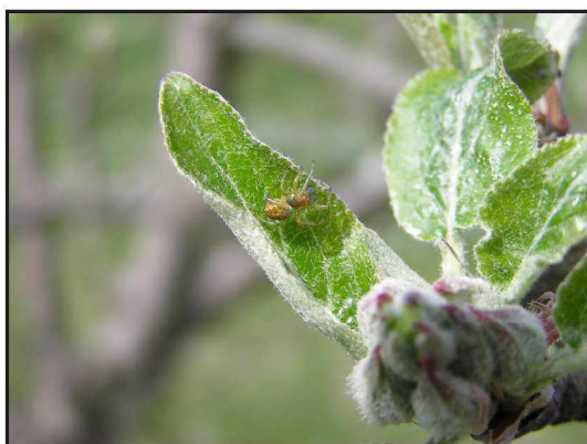
Billede 1. Araniella sp. edderkop på æbleblad.

Når man aktivt fremmer nyttedyr ved design af plantagen kaldes det på engelsk „conservation biological control“, eller på dansk funktionel biologisk bekæmpelse – man fremmer den funktionelle biodiversitet. I foråret 2005 gennemførte vi en feltundersøgelse af hegn omkring æbleplantager for at opnå et første mål for de forskellige hegns værdi som kilder til nyttedyr for æbleplantagen.