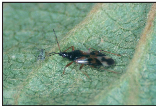
Billede 2. Almindelig næbtæge med en æblebladlus.

Fire almindelige hegnsarter såvel som æbletræerne blev undersøgt først i maj og igen sidst i maj. På alle lokaliteter var hegnene adskilt fra æbletræerne af en stribe udyrket græs eller ukrudt, eller i et enkelt tilfælde af en small jordvej. Afstanden mellem hegn og træer var 2–6 m. Vi undersøgte fire ellehegn ( Alnus glutinosa (L.) Gaertn., A. incana (L.)), to blandede hegn med hylde, tre tjørnehegn og et hasselhegn. Fodposerne blev også undersøgt. Leddyr (insekter, mider og edderkopper) blev indsamlet fra træerne ved hjælp af bankning af grene over et tragtformet indsamlingsnet, mens leddyr fra fodposen blev indsamlet med insektnet. Efterfølgende blev alle indsamlede dyr bestemt til art, slægt eller familie i laboratoriet. Insektdata blev analyseret for effekt af hegnstype, træart og fodpose på sammensætningen af leddyr. Et Renkonen index blev brugt til parvis at vurdere