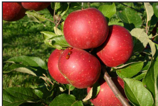
Billede 2. Marie æbler som mødested.

Frugt og bær trives godt på øerne. En vigtig årsag til dette er at nattefrost i maj kan tage pynten fuldstændigt af frugt- og bærudbytter, men den kolde oplevelse er sjælden, når man er omgivet af lunkent vand, som øboere jo er. Frugt og bær giver også trivsel til dem, der spiser dem. Indholdet af sundhedsfremmende stoffer er i frugt og bær større end i nogen anden landbrugsafgrøde, så det er produkter, vi burde spise flere af. Det budskab har folk efterhånden også forstået. Ifølge Danmarks statistik blev omsætningen af økologisk frugt næsten fordoblet fra 2003 til 2005. se tabel 1.