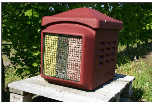
Billede 3. "Nyttedyrshotel". Især vilde bier har stor gavn af kasser som denne som erstatning for deres naturlige bosteder

Et simpelt regnestykke siger, at med det nuværende areal af øko-æbler og det nuværende forbrug, skal der bare et udbytte på 7 t/ha til at dække forbruget. Det burde være et opnåeligt mål ifølge forsøgsresultaterne, men forsøget viser også, at der er stor risiko for tab i enkelte år. Den største chance for at lykkes opnås ved at dyrke de bedste sorter, og holde sig til et klima, der egner sig til frugt, f.eks. på øerne.