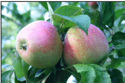
Billede 1. Aroma æbler