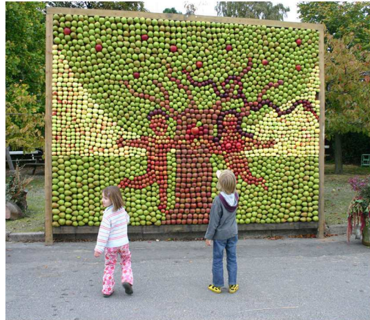
Billede 4. Æbler kan også bruges til andet end at spise og presse saft af. Her er det en kendt historie der er afbilledet med æbler.

Hvis du er interesseret i at blive frugtavlere, så søg vejledning i god tid, for det er i planlægningen, at mange problemer kan forebygges.