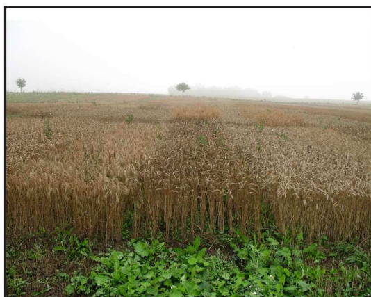
Billede 1. Vintersæd artsforsøg 2007.

Sorterne der er anvendt fremgår af tabel 1. Jordtypen er JB 6. Forfrugten var hvidkløver.