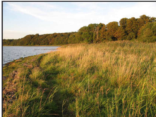
Billede 6. Mere åben vegetation efter afgræsning med får på strandeng, Tempelkrogen.

Erfaringerne viser, at der er gode muligheder for at ændre naturtilstanden på tilgroede area-