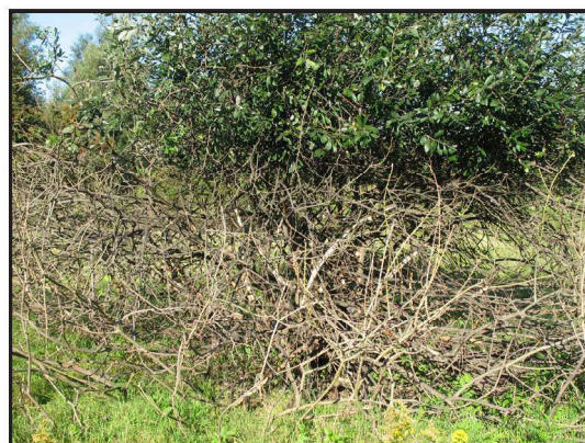
Billede 4. Krat og buske afgræsset af geder i løbet af få måneder.

Geder er således i stand til at regulere flere træ- og buskvækster effektivt, hvis de afgræsser på et areal over en længere periode, og hvis væksterne ikke er blevet højere, end at gederne kan nå helt til tops. Ved afgræsning med geder gen-