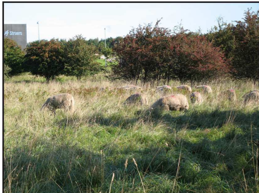
Billede 5. Får græsser i Råmosen i nærheden af Ballerup

nem flere år kan de sandsynligvis også gøre det af med selv store buske og træer, da de fuldstændig afbarker dem.