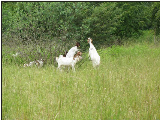
Billede 3. Geder står gerne på bagbenene og æder af buske og træer.

og opformere sig. Kreaturer er gode til at fortrænge grove græsser og halvgræsser og skaffe plads til finere græsser og urter. Vedplanter æder de kun i begrænset mængde. Kvæg kan ved afgræsning normalt ikke hindre en tilgroning med uønskede arter på langt sigt, med mindre der er tale om frodige græsenge.