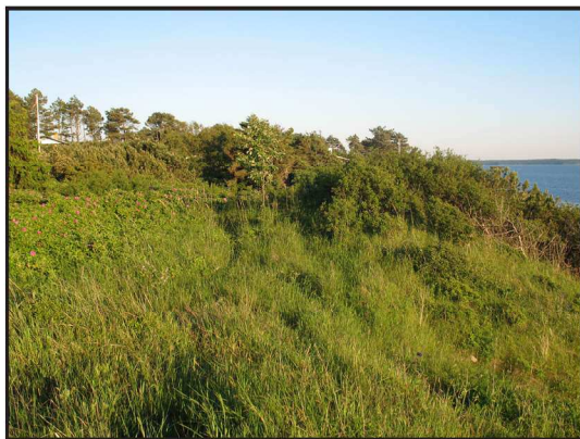
Billede 1. Tiltagende tilgroning på naturareal, Røsnæs

Men hvad gør man så lige, når buske og træer breder sig år for år eller kolonier af tidsler, brændenælde eller siv bliver større og større? Ikke bare giver det problemer i forhold til, om arealet er berettiget til tilskud efter enkeltbe-