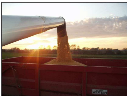
Billede 3. Selv med 30-40 % vand løber kernerne let igennem tømmelegnen.

Når det har været muligt at opnå et godt resultat i 2007, har majsen bevist, at den også fremover fortjener en fast plads i vores planteavlssædskifte på Jennelgaard.