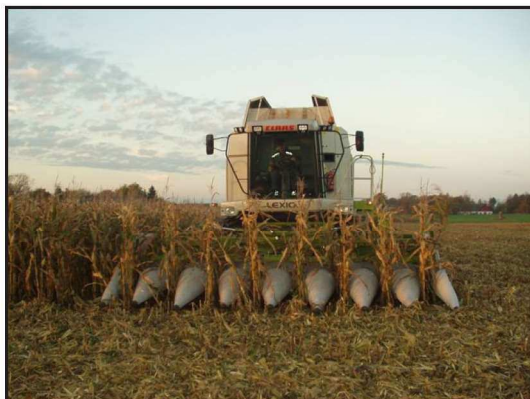
Billede 4. Udover plukkebord er der ikke monteret ekstraudstyr. Plukkebord øger kapaciteten, giver mindre spild og der laves en ren vare.

Majsen er solgt til æg og svineproducent.