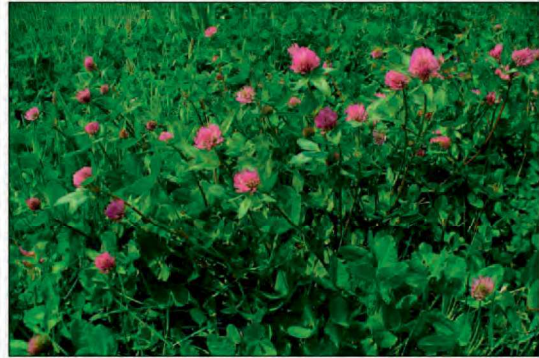
Billede 2. Rødkløver har et højere udbyttepotential og dermed også potential for bedre økonomi.

lige at tegne kontrakter på. Lad dig dog ikke skræmme af dette, hvis du mener at kunne løfte en opgave med at dyrke f.eks. 1 ha purløg eller timian til frø eller 5 ha karse. Der sker hele tiden mindre udskiftning af avlere og så er det jo en fordel at stå på ventelisten, hvis der skulle blive mulighed for at få dyrkningen af en spændende afgrøde. I det følgende vil jeg derfor kun beskæftige mig med de tre mest dyrkede økologiske frøafgrøder - alm. rajgræs, hvidkløver og rødkløver - se figur 1.