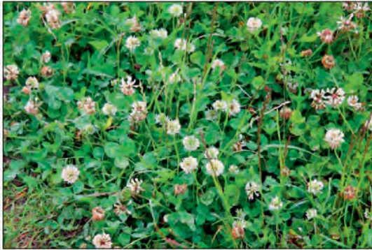
Billede 1. Hvidkløver til fremavl er kritisk i forhold til varme ved blomstring og tørt vejr omkring høst.