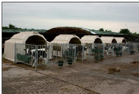
Billede 3. Kalvene kommer lige som i DK ud i hytter. Først i små hytter hvorefter de flyttes sammen i større hytter.

Bygningsmassen på Brodowin er i store træk som den blev overtaget fra DDR tiden. Meget, meget solidt betonbyggeri - men ikke altid lige nemme at arbejde i. Der foregår derfor løbende tilpasninger i de bygninger, som anvendes som stalde. Der er planer om