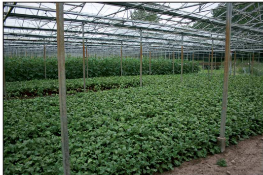
Billede 2. Væksthuset med rødbeder til bundtsalg i forgrunden og agurker i baggrunden.

Der dyrkes 20-25 forskellige arter grønsager på friland - primært til friskmarked i Berlin. Brodowin kan ikke dyrke nok til at dække efterspørgslen og derfor samarbejder man med flere lokale avlere, for at kunne skaffe nok til pakkeriet.