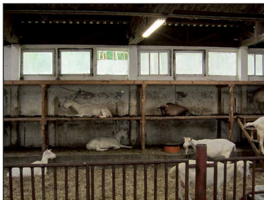
Billede 5. Gederne stald er en gammel svinestald, som er ombygget til formålet.

plantagen. En udvidelse af hønseholdet er på tale, idet efterspørgslen på æg og kød er stor. Der kunne afsættes fra 1.000-1.500 flere høns end nu.