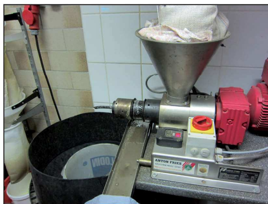
Billede 1. Her presses der olie ud af solsikkerne.

Der dyrkes lupiner til forsyning af protein i kraftfoder og selvfølgelig også for at forøge kvælstofforsyningen. Lupinerne passer godt til de lette jordtyper. En anden afgrøde, som dyrkes meget er lucerne. Den er valgt fordi den er en god, og relativ dyrknings sikker afgrøde under de tørre dyrkningsforhold. Her klarer lucernen sig godt når kløvergræsmarkerne er helt brune af tørke. Desuden har lucernen en god eftervirkning.