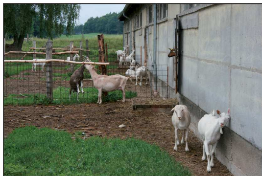
Billede 4. Gederne er krydsningsdyr mellem gamle tyske racer.

Der er 400 æglæggende høns på Brodowin. Racen er jævnfør Demeter-reglerne en 2-formålsrace, som egner sig til såvel æg- som kødproduktion. Hønseholdet opstaldes i mobile stalde, som flyttes rundt i æble-