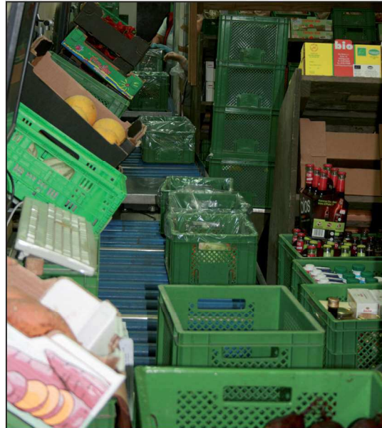
Billede 7. Abonnementskasserne pakkes ud fra kundernes bestilling. Af hensyn til trafikken leveres kasserne ud om natten.

Supermarkedet Bio Company, som har mere end 30 butikker i Berlin og forstæder, afsætter mange af mejeriets produkter. Vi besøgte en af afdelingerne og genfandt såvel mælk som oste fra Ökodorf Brodowin. Her bemærkede vi, at Bio Company er rigtig gode til at profilere deres leverandører i butikkerne.