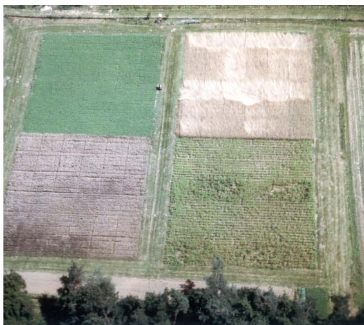
Luftbild des Darmstädter Versuchs: Am Beispiel Roggen (oben rechts) sieht man in etwa die Varianten von links nach rechts steigend: Düngungshöhe horizontal: Düngungsvarianten (die mineralische Variante lagert)

Da nur die N-Gehalte für die Mengenermittlung der organischen Dünger maßgebend sind, schwän-