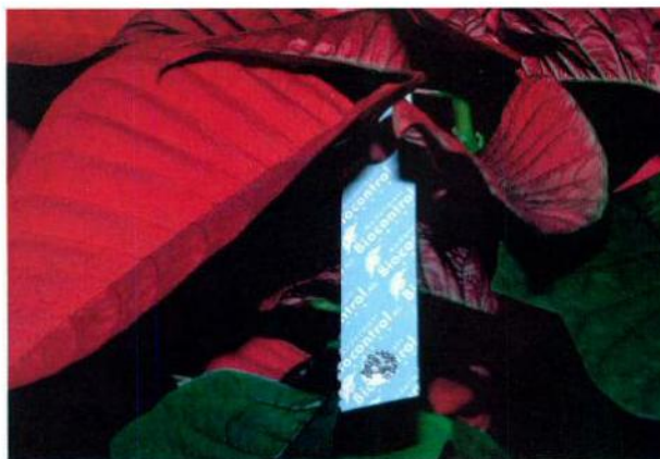
Nützlingseinsatz, wie z.B. in Poinsettien, funktioniert in der Regel gut.