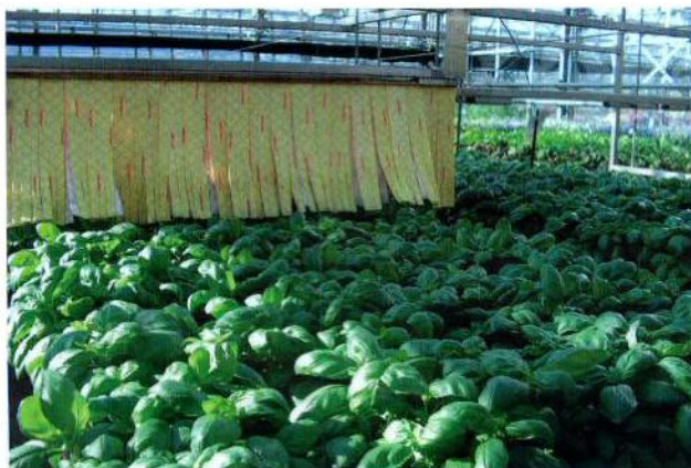
Streichelwagen, z.B. kombiniert mit Giesswagen, können bei richtigem Einsatz die Pflanzen kurz und kompakt halten.