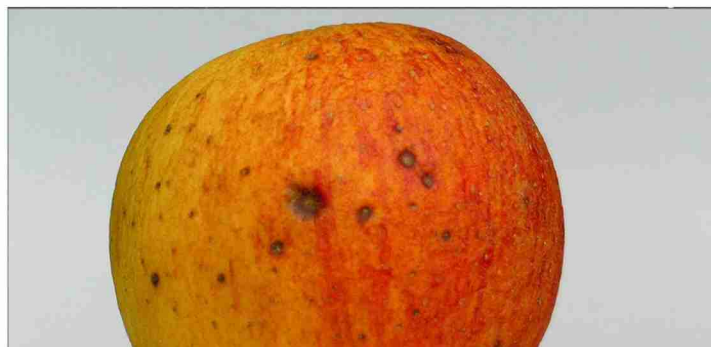
Frühbefall von Lentizellenfäule kann durch Einsatz von Myco-Sin stark reduziert werden