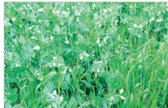
Obr. 2 - Maloparcelkové pokusy - směska hrachu a ječmene

U obilnin pěstovaných ve směsce s hrachem byl obsah dusíkatých látek (NL) statisticky významně vyšší než u obilnin pěstovaných v monokultuře (graf 1). Obsah NL v hrachu nebyl jeho pěstováním ve směs-