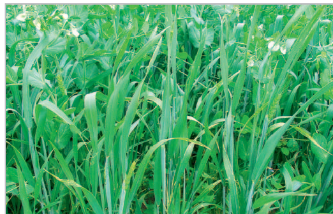
Obr. 1 - Maloparcelkové pokusy - směska hrachu a pšenice

studii může být až šedesát procent fixovaného dusíku využitelných v následujícím roce při produkci následných plodin. Fixovaný dusík nevyužívají pouze luskoviny, ale v případě pěstování ve směskách mají z tohoto procesu užitek i další komponenty směsky. Problémem je však zvýšená citlivost luskovin na různé výkyvy v prostředí, která je příčinou jejich výnosové nestability. Tato citlivost se týká