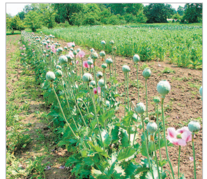
Pás ozimého máku z pozdního výsevu (jediný nepřivalený po výsevu) ochránil jarní mák před napadením krytonoscem makovicovým (Budyně nad Ohří 2010)

E-ventus: ošetření elektronovým zářením, HWT: ošetření horkou vodou, obojí snižuje klíčivost, nutno navýšit výsevek