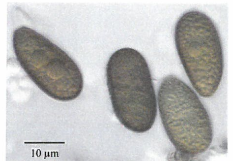
SPORER – De meget karakteristiske konidier hos Diplodia seriata taget fra en Elstar-frugtmumie.

land syd for Elben. Længere mod nord har vi kun set sommersortråd på økologisk producerede æbler i Årslev. Åbenbart danner Elben på nuværende tidspunkt den nordlige grænse for sommersortråds økonomiske betydning.