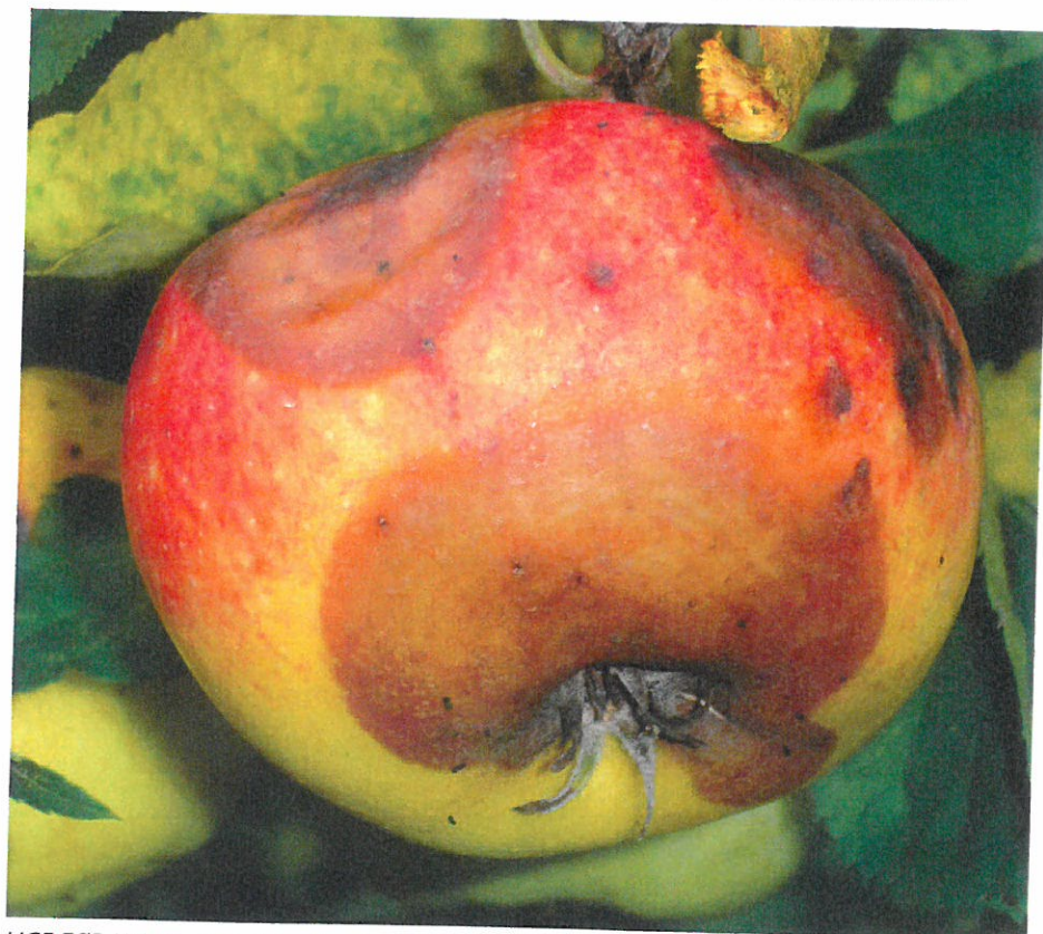
LIGE FØR HØST – Brunligt sekundært råd er symptomet på sommorsortræd lige før høst. Her på frugt af Dalinbel. Jork, 15. oktober 2010.

Infektionscyklussen hos D. seriata kan dog kun opretholdes ved, at frugtmumier inficeres af D. seriata om sommeren, overvintrer på træerne, og frigiver sporer den efterfølgende sommer. Dette ses eksempelvis i nordtyske frugtplantager med integreret produktion. På nuværende tidspunkt er analyse af frugtmumier derfor den mest sikre metode til at påvise D. seriata .