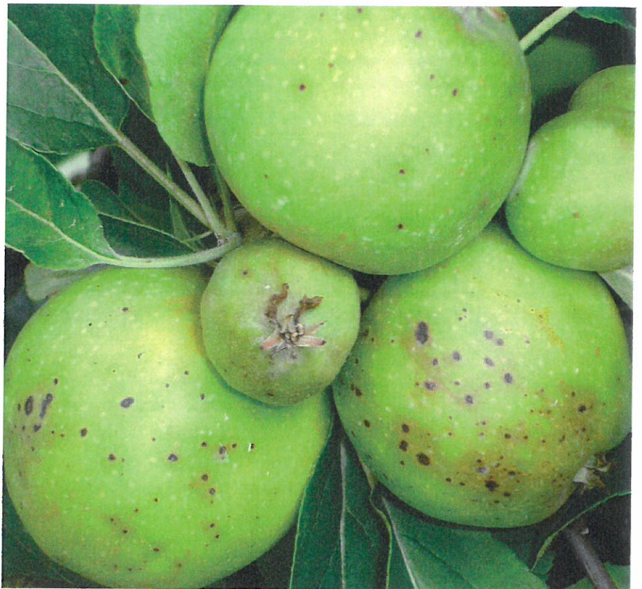
TIDLIGT SYMPTOM – Sorte prikker under én millimeter i diameter er primærstadiet for sommersortråd. Her på henholdsvis voksende og uudviklede frugter af Elstar, Jork, 16. juli 2008.

Før 2007 var denne svamp kun kendt fra varmere klimazoner. Med det engelske navn 'black