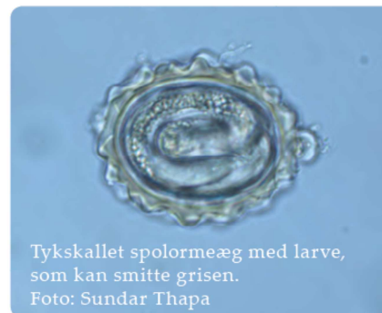
Tykskallet spolormeæg med larve, som kan smitte grisen.

Et igangværende tre-årigt projekt (PAROL) under Organic RDD arbejder derfor på at kortlægge smitten i fem danske besætninger, for at forbedre rådgivningen omkring kontrollen af spolorm.