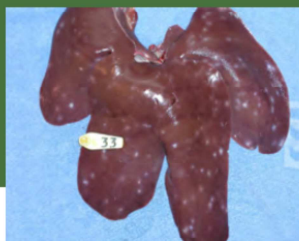
Lever med ormepletter