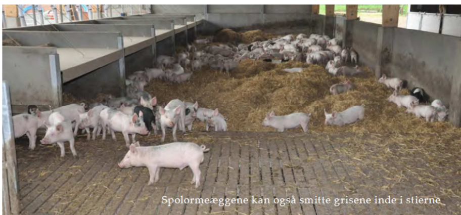
Spolormeæggene kan også smitte grisene inde i stierne

Spolormen er uden tvivl godt tilpasset grisen og dens levevis. Selv i SPF besætninger kan parasitten være svær at kontrollere. PAROL projektet har dog hjulpet med at skabe en bedre sammenhæng med tidligere viden. Sammenligningen af forskellige besætninger har også været med til at kortlægge, hvor grisene smittes og hvor der stadig er udfordringer at tage hul på, for at kunne forbedre rådgivningen ude i besætningerne.