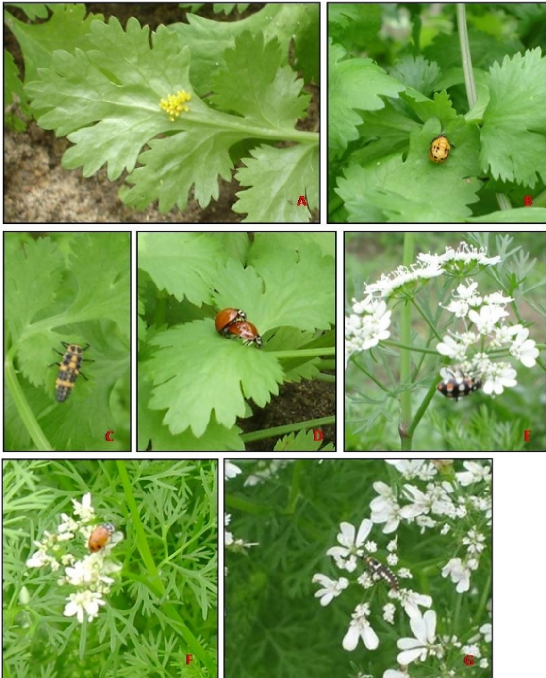
Figura 2. Diferentes estádios de desenvolvimento das joaninhas utilizando recursos do coentro, na Fazendinha Agroecológica Km 47, Seropédica/RJ.

De acordo com Resende et al. (2006), essas três espécies são predadoras do pulgão da couve, Lipaphis pseudobrassicae Davis, em condições de campo. Mendes et al. (2000) encontraram resultado semelhante em levantamento de predadores de pulgões realizado na cultura da