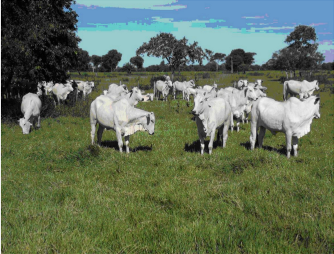
Figura 1: Foto da pecuária da Fazenda São José

temporal, como também econômico energético da pecuária da fazenda, podendo contribuir futuramente para uma possível tomada de decisão.