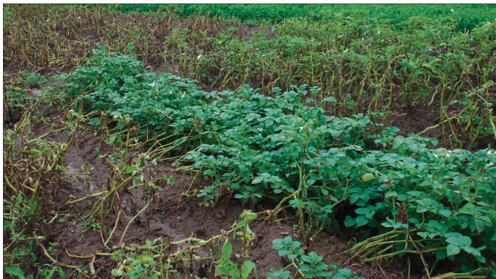
Eine krautfäuletolerante Sorte umgeben von anfälligen Kartoffelsorten.

Zwei wichtige Neuentwicklungen gab es vor 10 Jahren: Mit den Sorten Naturella und Appell schien der Durchbruch gegen die Krautfäule gelungen. Doch die Euphorie hielt nur wenige Jahre an. Appell war zwar sehr tolerant gegenüber der Krautfäule, sie bildete aber viele, eher kleine, ovale Knollen mit glatter, heller Schale. Die Krautentwicklung und damit die Unkrautunterdrückung war schwach. Ein weiterer Nachteil war ihre Empfindlichkeit auf Pulverschorf. Bei Naturella war