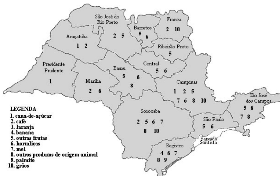
Figura 2 - Distribuição Espacial dos Principais Produtos Orgânicos, por RA, Estado de São Paulo, 2004.