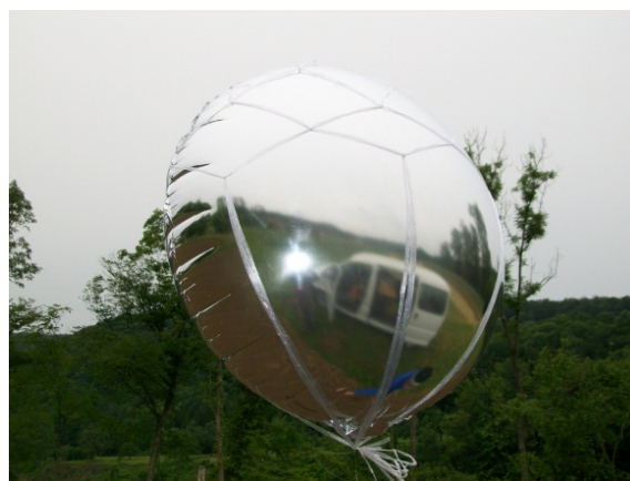
Abbildung 2: Folienballon (75 cm Ø) mit Netz