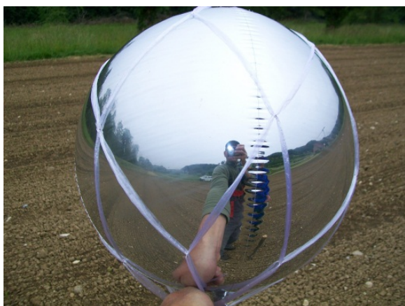
Abbildung 1: Spiegelballon (40 cm Ø) mit Netz