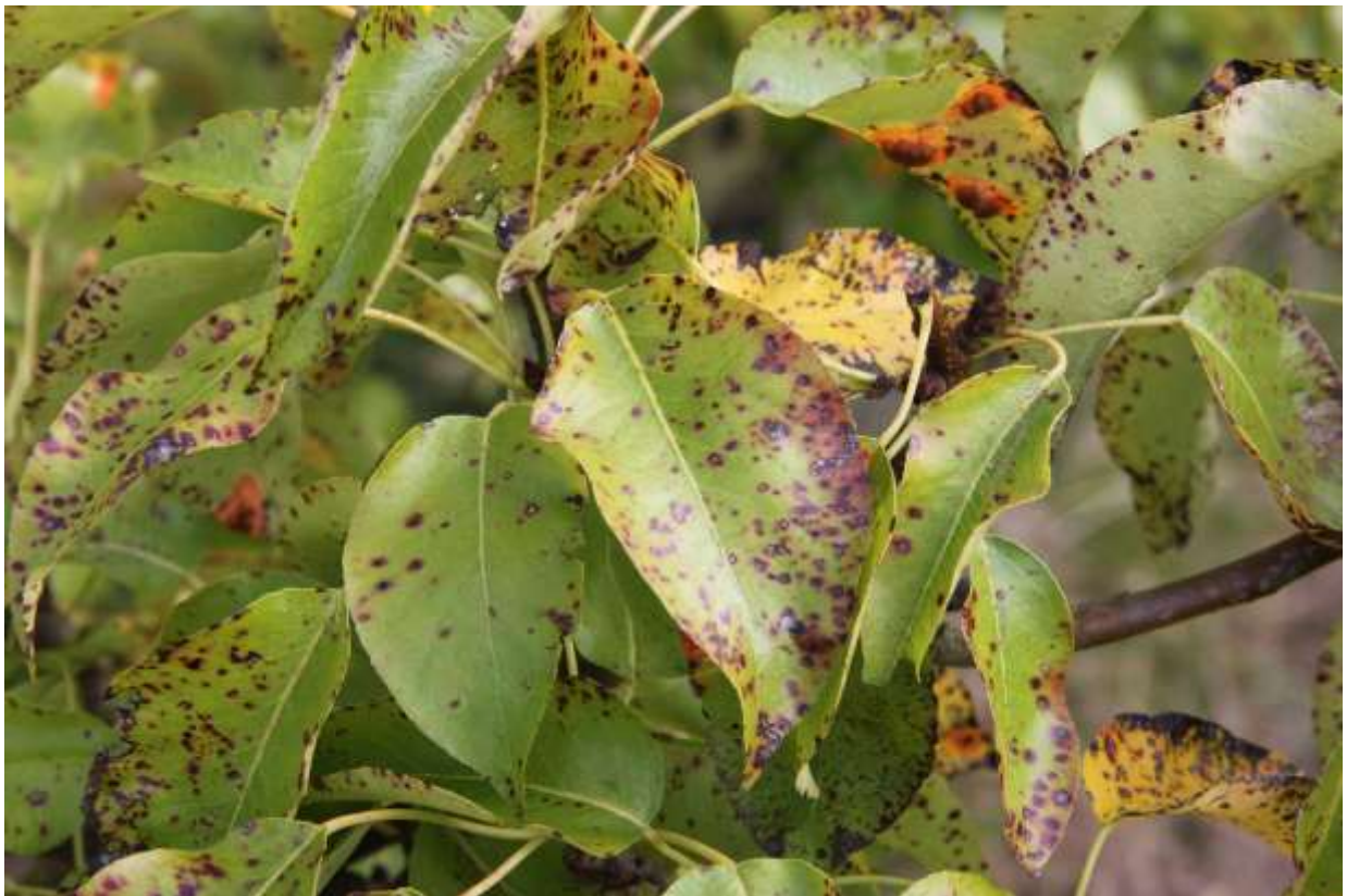
Pærebladgalmiderne er i de sorte/brune pletter