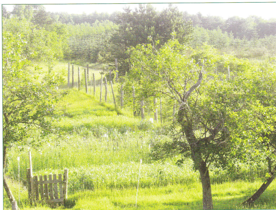
Forsøgshaven med de mange kornsorter

Planteforædling er i dag koncentreret på nogle få firmaer, og udviklingen går fortsat mere og mere i den retning. Bare 10 multinationale firmaer kontrollerer i dag næsten 70% af verdens såsædssalg.