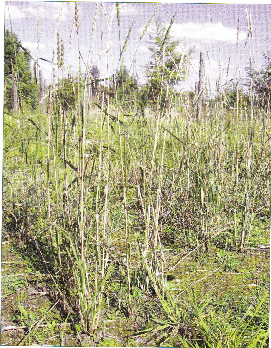
Moden hvedeplante. Ved grunden ses de nye grønne skud, der spirer frem sidst på sommeren.

Husdyrgødningen får ofte skyld for at være synderen i landbrugets næringsstofforurening, og det er da