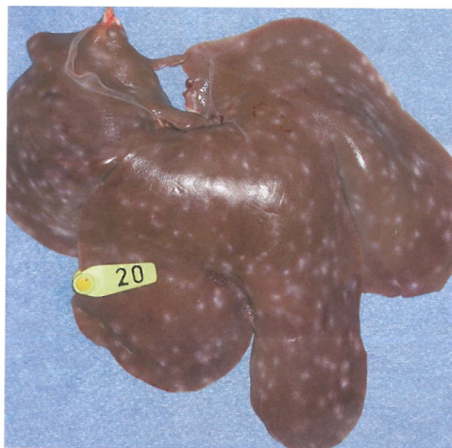
Spolormens arven vandrer igennem grisens lever og giver hvide ormepletter.

Hvis æggenes deponeres udendørs, dør langt de fleste indenfor nogen få uger. I en besætning, hvor der udskilles mange millioner af æg hver dag, er der dog stadig rigeligt tilbage til at sikre en fortsat smitte i mange år. Som nævnt i fagmagasinet SVIN tilbage i november 2011 er et projekt derfor ved at kortlægge smitteudbredelsen i fem danske økologiske svinebesætninger.