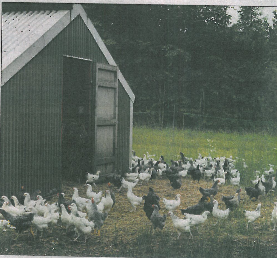
De nye kyllinger trives på Gothenborg. Den lyse er en sussex-krydsning, og den anden en sort kylling, der får et gult skind.