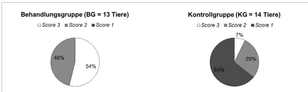
Abbildung 2: Verteilung der erfassten Scores innerhalb der Betäubungsbox bei den Tieren der beiden Versuchsgruppen. (1 = Tier versucht Kopf zu entziehen/rückwärts zu treten, 2 = Tier verhält sich neutral, 3 = Tier reckt der Person den Kopf entgegen)

Auf dem Betrieb wurde dies durch die verminderte Ausweichdistanz und die häufiger aufgetretene freiwillige Annäherung bei BG-Kälbern sichtbar. Dies verdeutlicht, dass die BG-Tiere eine verminderte Furcht vor Menschen zeigten. Ähnliche Ergebnisse fanden KROHN et al. (2001) in einer Studie mit Milchviehkälbern. Dabei wurden Tiere aus der Milchviehhaltung verwendet, welche der Rasse Danish Friesian angehörten und mittels Eimertränke auf-