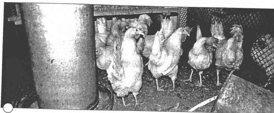
Ustájení nosnic Lohmann LSL na podestýlce