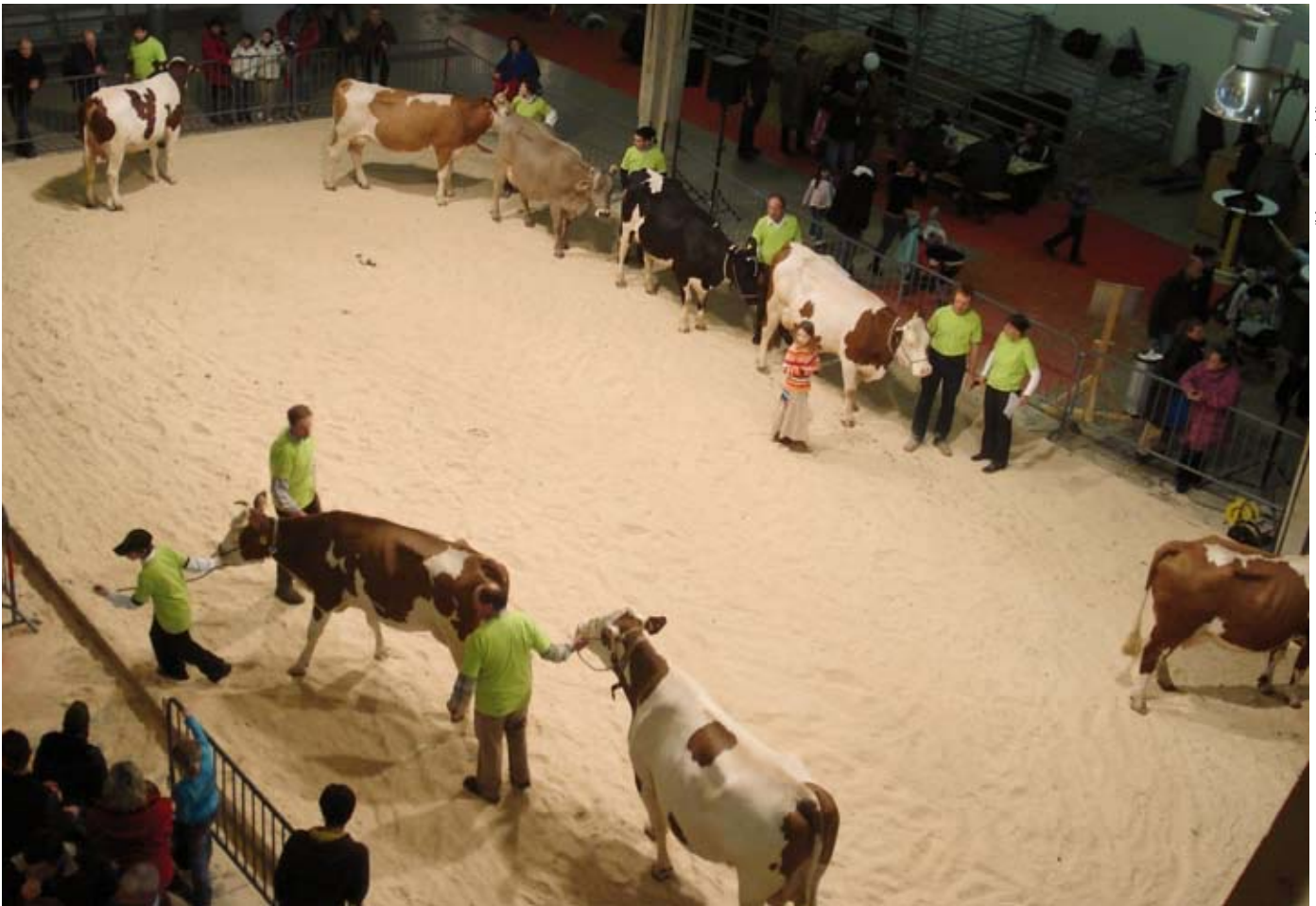
Die Biokühe an der Swiss'expo im Ring.