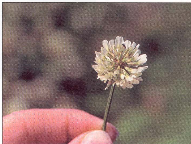
Kløversnudebiller i hvidkløver.

Efter klækningen, der foregår fra sidst i juli og ind i august, forlader billerne hvidkløveren og flyver til hegn og småskove, hvor de i store mængder kan