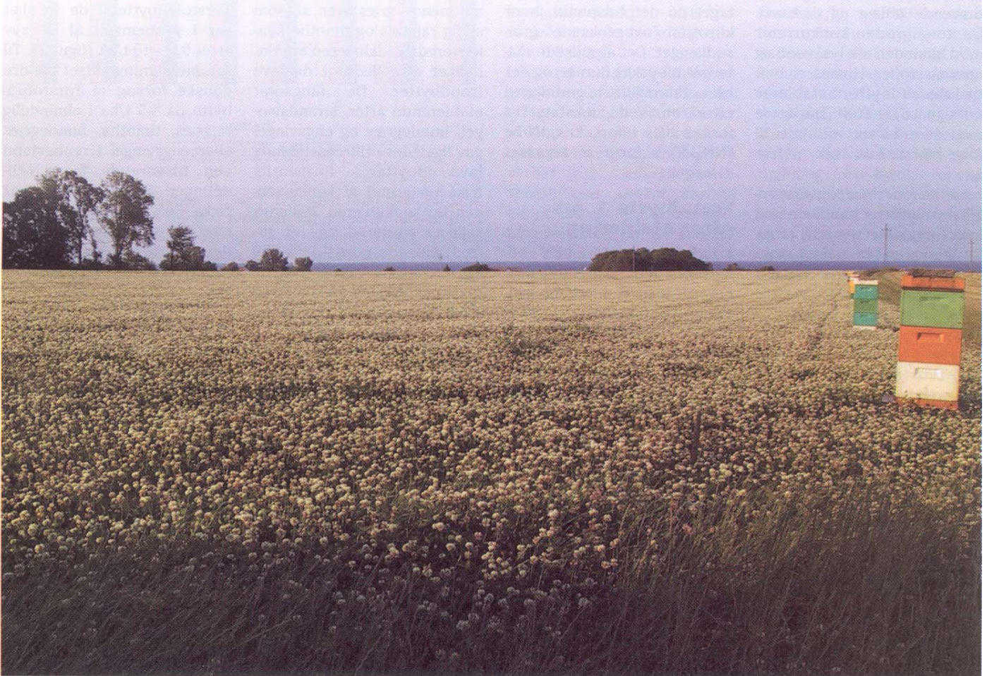
Økologisk hvidkløver.

Der er imidlertid forskning i gang på området, og det er vores mål i løbet af de næste år at få løst en del af de her skitserede problemer.