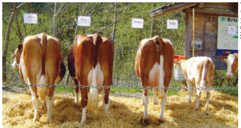
Zuchtfamilienschau der Kuh Zina aus der Z-Linie von Christian Kropf. Zina gab in 7 Laktationen durchschnittlich 6686 kg Milch pro Jahr mit 4,32 Prozent Fett und 3,7 Prozent Eiweiss.

Tiere: 50–60 Milchkühe im Boxenlaufstall, 1–2 Stiere, 5 Pferde, kleine Herden von Schafen, Ziegen, Kaninchen, Hühnern, Gänsen, Tauben und Enten