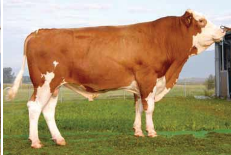
Die Stiere Pirmin (links) und Pit von Hans Braun. Zuchtwerte Pit: Milch kg +39, Fett % +0,2, Eiweiss % -0,02, Persistenz 109 (Sicherheit 65; noch nicht alle Zuchtwerte vorhanden). Für Pirmin gibt es noch keine Zuchtwerte.