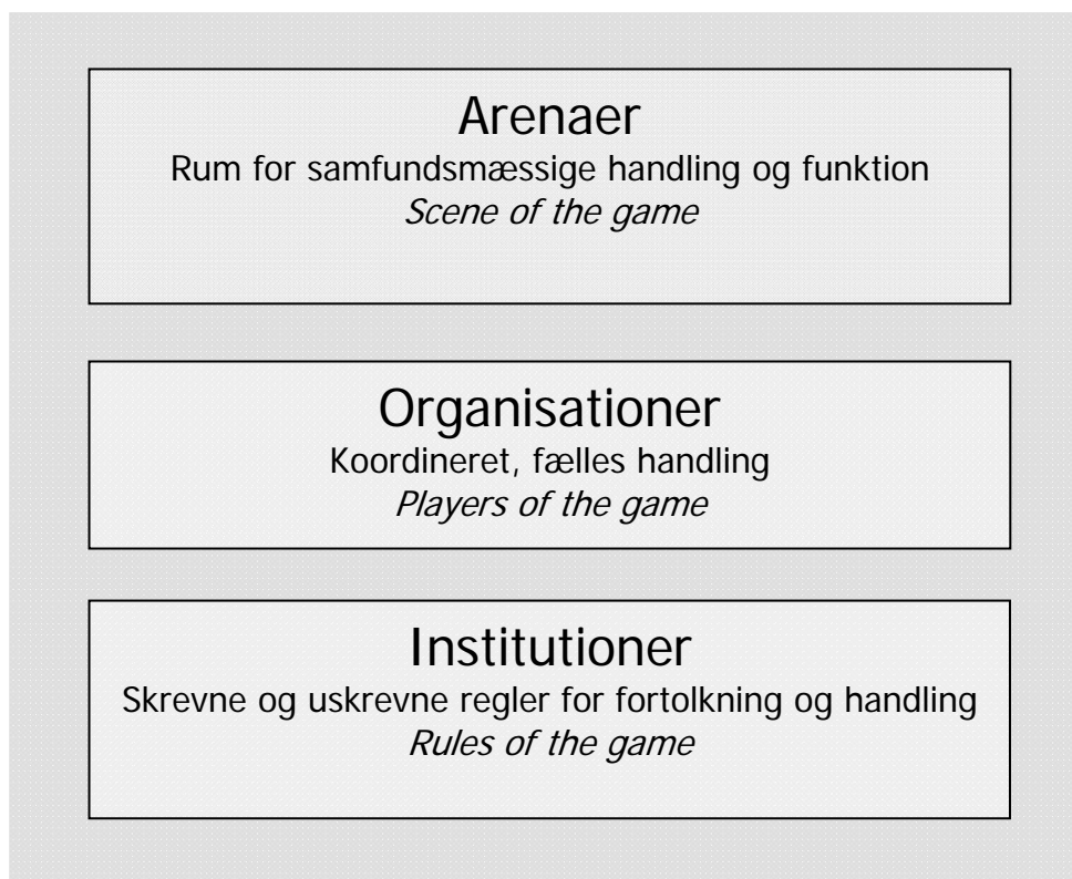
Figur 2: Det samfundsmæssige spil og dets elementer

Tilsammen kan de tre felter illustreret ovenfor beskrive et samfunds institutionelle arrangement og herved anvendes til nærmere at undersøge et givet samfunds institutionelle kapacitet.