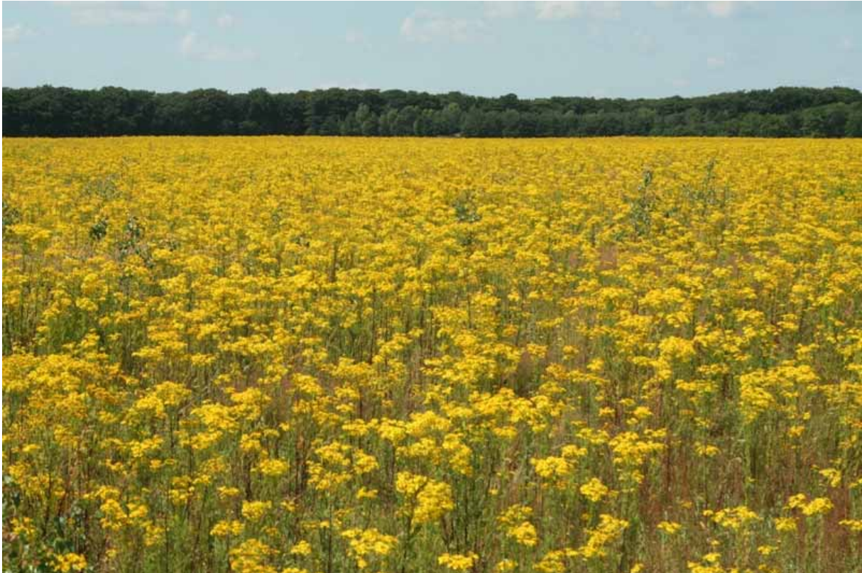
Figuur 1: Met name op verschralende natuurgraslanden vormt Jacobskruiskruid nog steeds een toenemend beheersprobleem. De gronden verliezen agrarische waarde, zoals hier op de Veluwe waar de Jacobsvlinder wel voorkomt maar de Jacobskruidaardvlo Longitarsus jacobaeae (nog) niet.