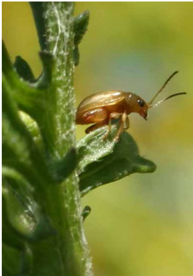
Figuur 3: De Jacobskruid aardvlo Longitarsus jacobaeae op Jacobskruid. De kevertjes zijn ongeveer 2,5 mm lang, de mannetjes ongeveer een millimeter kleiner dan de vrouwtjes. Karakteristiek voor deze groep kevers (Aardvlooien) zijn de dikke achterpoten waarmee ze ver kunnen springen.