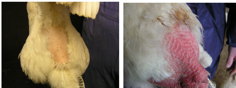
Figuur 3-1: Respectievelijk normale en rode huidskleur.