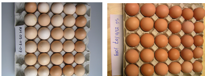
Figuur 3-7: Eieren met respectievelijk lichtere en donkerdere schaalkleur

De dooierkleur werd lichter in geval besmetting met grote of kleine spoelworm (t-toets, p=0.002 ) of haarworm (t-toets, p=0.035 ). Het mechanisme hierachter kan zijn dat de wormen het pigment uit het voer hebben opgegeten of de darmen hebben aangetast, waardoor minder pigment kon worden opgenomen (R. van Wee, persoonlijke informatie). De dooierkleur werd niet beïnvloed door de hoeveelheid uitloopgebruik.