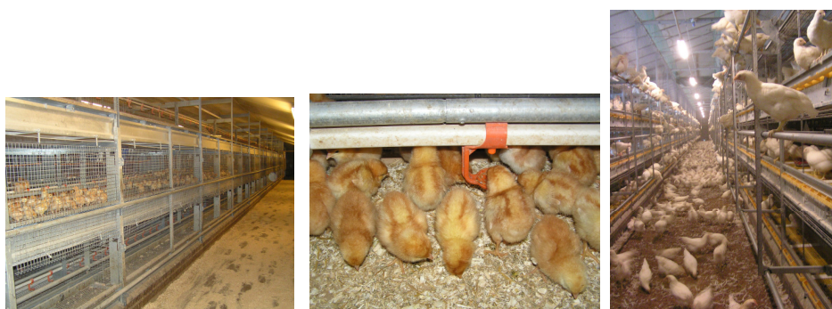
Figuur 4-1: Opfok in een volièrestal, waarbij de kuikens de eerste weken opgesloten zitten.

Groepsgrootte Twee koppels die als jonge kuikens in kooien zaten, hadden een groepsgrootte van 18 en 82 kuikens. Van de andere kooikoppels is de groepsgrootte niet bekend. 25 koppels die niet in kooien zaten en waarvan de groepsgrootte bekend was, hadden een gemiddelde groepsgrootte van 13.800 dieren.