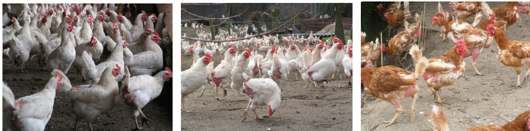
Figuur 3-2: Respectievelijk weinig/geen verenpikschade, matige verenpikschade en ernstige verenpikschade.

Verenpikken werd volgens de pluimveehouders waargenomen meteen vanaf het begin, tijdens de legpiek of vanaf ca 40 weken. Oorzaken die door de pluimveehouders genoemd werden, waren de omstandigheden tijdens de opfok, algemene ziekteproblemen, een voedingskundig gebrek of stress door verhuizen, aan de leg komen of ophokplicht. Pluimveehouders deden verschillende dingen ter preventie. Het meest genoemd werden: naar buiten, afleiding verschaffen, licht dimmen en rode lampen. Een enkeling deed bij aankomst juist alle lampen aan, zodat er later nog wat te dimmen viel. Een andere pluimveehouder verstreekte juist extra eiwitrijk voer. Min of meer dezelfde maatregelen werden genoemd als maatregel voor als de kippen eenmaal begonnen waren met verenpikken. Aanvullend werden vitamines en mineralen genoemd. In het algemeen beoordeelden de onderzoekers een koppel eerder als verenpikkend dan de pluimveehouders.