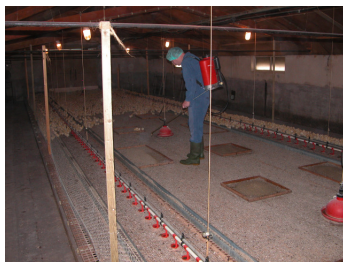
Figuur 4-3: Opfokstal met jonge kuikens opgesloten op de beun (waarin een sprayenting wordt toegediend).

Bezetting Van 33 koppels was de bezetting tijdens de eerste vier weken bekend, de periode waarin de kuikens meestal gehouden worden op een beperkte ruimte met voer en water. Gemiddeld was de bezetting 21 dieren per vierkante meter (min 8.5 – max 33.5). Dit is inclusief de kooikoppels, die een bezetting hadden tussen 16 en 21 dieren per m 2 .