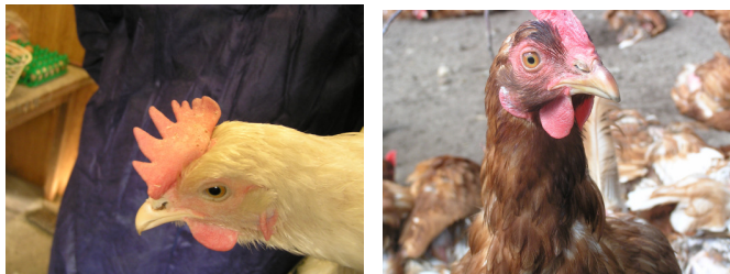
Figuur 3-6: Hennen met respectievelijk een lichte en een donkere kam.

maat voor diergezondheid. Kamkleur zoals wij het gemeten hebben, is opgebouwd uit een L-, A-, en B-waarde. In een kleurenreeks van lichtroze naar donkerrood gaat de L-waarde omlaag en de A- en B-waarden omhoog. Uit onze gegevens bleek in eerste instantie het ras bepalend te zijn voor verschillen in kamkleur (L-waarde: R^2=29 , p=0.03 , A-waarde: R^2=24 , p=0.009 en B-waarde: R^2=46 , p<0.001 ). Meer uitloopgebruik bleek gerelateerd aan een lagere L-waarde, dus donkerdere kam ( R^2=29 , p=0.003 ). Er was een trend dat meer daglicht in de stal gerelateerd was aan een lagere L-waarde, dus een donkerdere kam ( R^2=36 , p=0.07 ). Koppels die banger reageerden op de onderzoekers hadden een significant hogere L-waarde ( R^2=38 , p=0.021 ), een lichtere kamkleur. Er was een trend dat koppels bij wie één of meer darmparasieten in de mest werden aangetoond, een hogere B-waarde (t-toets, p=0.06 ) hadden, dus een roedere kam. Uit onderzoek van Fölsch e.a. (1994) bleek hetzelfde effect van ras, uitloop en daglicht op kamkleur. Er is geen verklaring voor het effect van parasieten op de mogelijk donkerdere kamkleur.