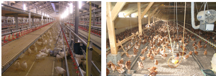
Figuur 4-2: Opfok in respectievelijk een 'nivo-varia' stal en een grondstal.