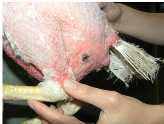
Figuur 3-3: Huidwond veroorzaakt door pikkerij

Pikwonden zaten altijd rond de cloaca of op de legbuik en werden gezien in 25 van de 49 koppels (51%), waarbij koppels t/m 4 % pikwonden niet zijn meegeteld. Pikwonden zagen we overigens alleen op kale lichaamsdelen. Hoewel je het bij goed bevederde kippen moeilijk ziet, hadden we toch de indruk dat bij goed bevederde kippen geen pikwonden aanwezig waren.