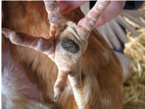
Figuur 3-5: Korst op de voetzool, overigens een extreem groot voorbeeld

beide poten zaten. Er bleek een relatie te zijn met uitloopgebruik, dat wil zeggen: naarmate de kippen meer buiten kwamen, ze meer voetzoolwondjes hadden ( R^2=14 , p=0.025 ). Als er één procent meer kippen uit een koppel naar buiten ging, zagen we je 0.1 % meer kippen met voetzoolwonden. Er bleek geen relatie te zijn met het ammoniakgehalte in de stal en de aanwezigheid van lang (=scherp) stro in de scharrelruimte. Mogelijk hingen de wondjes samen met nattigheid in de uitloop, waardoor de voetzolen zachter en dus kwetsbaarder werden.