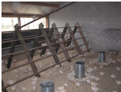
Figuur 4-4: Opfokstal met veel daglicht

Daglicht Gedurende de hele opfok had slechts één van de 35 koppels geen daglicht, 2 koppels hadden weinig, 15 voldoende en 8 hadden veel daglicht in de stal.